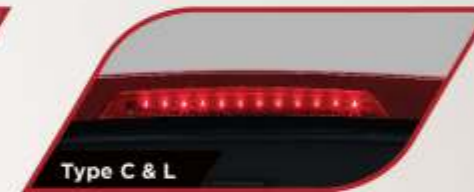
Type C & L

Memberikan penerangan lebih saat kondisi berkabut.