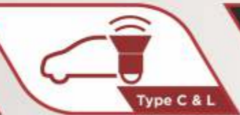
Type C & L

ISO FIX SEAT Fitur untuk mengunci kursi bayi pada bangku baris kedua.