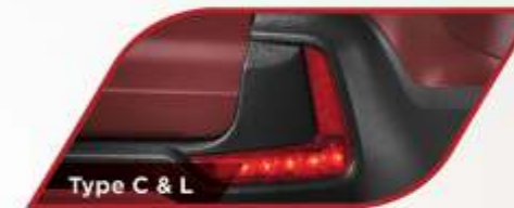
Type C & L

Penerangan lebih baik saat melakukan pengereman di malam hari.