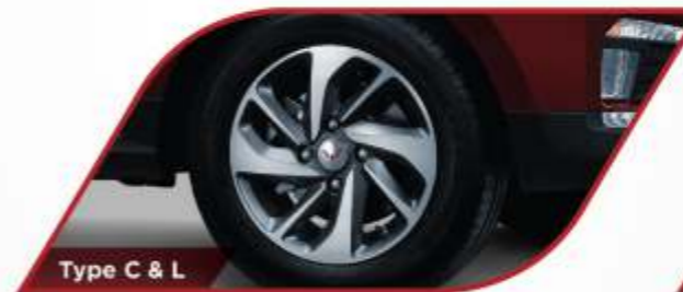
Type C & L

Arah pencahayaan lampu bisa diatur sesuai kebutuhan.