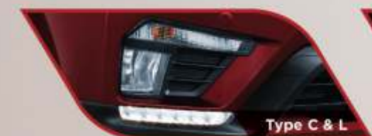
Type C & L

Memberi kesan modern pada bagian jendela.