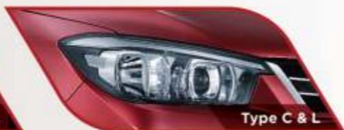
Type C & L