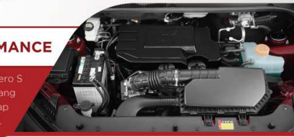
Engine 1.5L, with DVVT (Dual Variable Valve Timing), DOHC, MPI.

Wuling Confero S memberikan performa mesin yang bertenaga namun juga tetap hemat bahan bakar.