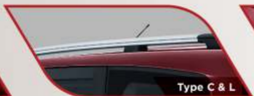
Type C & L