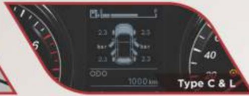
Type C & L

FRONT AND REAR PARKING SENSOR Sensor depan dan belakang yang memudahkan memarkir kendaraan.