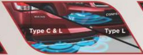
Type C & L

DUAL FRONT SRS AIRBAG Memberikan perlindungan lebih dan memperkecil resiko cedera.