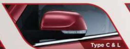
Type C & L

Semakin memberikan rasa aman saat berkendara.