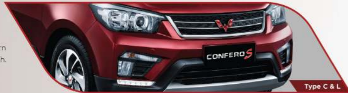
Type C & L

Desain grill yang modern dan bumper yang gagah.