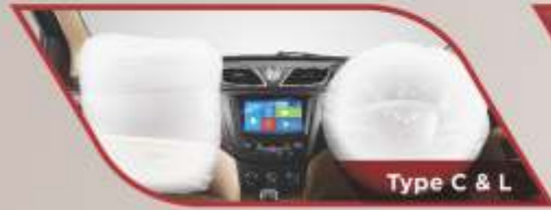
Type C & L

REAR PARKING CAMERA Parkir mundur menjadi lebih mudah.