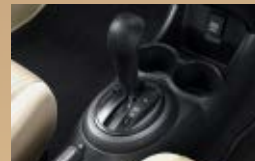
CVT (Continuous Variable Transmission)

CVT dengan Earth Dreams Technology untuk perpindahan transmisi yang lebih halus dan performa mesin yang maksimal serta konsumsi bahan bakar yang efisien.