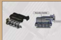
Torque Boost Resonator

CVT dengan Earth Dreams Technology untuk perpindahan transmisi yang lebih halus dan performa mesin yang maksimal serta konsumsi bahan bakar yang efisien.