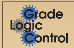
Grade Logic Control & Shift Hold Control

Manuver yang lincah dan mudah berkat radius putar 5,2m.