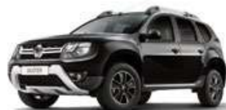
Черный металлик NOIRE NACRE