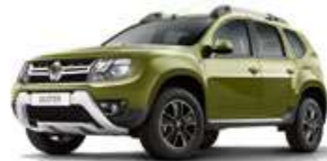
Зеленый металлик VERT OLIVETTE