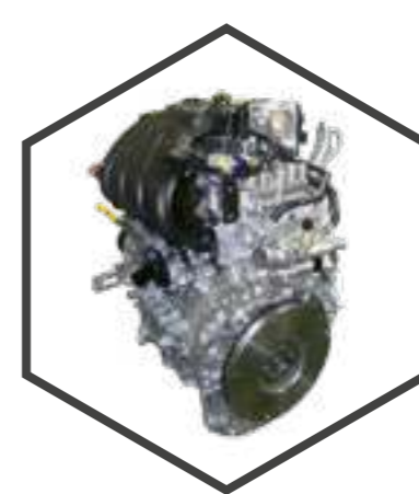
Двигатель бензиновый 1.6 л

с межсервисным интервалом 15000 км является одним из самых экономичных в классе и дает возможность преодолевать значительные расстояния без лишних остановок. Благодаря высокому крутящему моменту этот двигатель демонстрирует уверенную тягу на ранних оборотах.