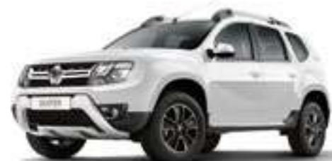
Белый неметаллик BLANC GLACIER