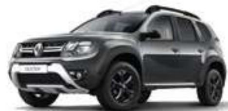
Темно-серый металлик DARK GREY