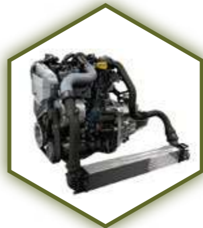
Двигатель дизельный 1.5 л dci

Renault DUSTER единственный автомобиль в своей ценовой категории, оснащенный дизельным двигателем. Именно этот силовой агрегат наиболее универсален и идеально подходит как для преодоления бездорожья или плохих дорог, так и для экономичного движения в городской среде.