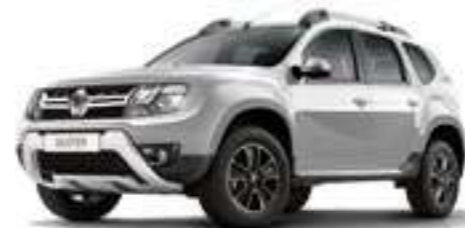
Серебристый металлик GRIS PLATINE