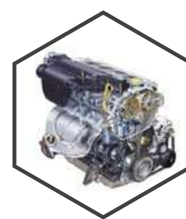
Двигатель бензиновый 2.0 л

обладает достаточной мощностью, чтобы справиться со сложными участками дороги. Он оснащен цепным приводом газораспределительного механизма, который не требует обслуживания на протяжении всего срока службы автомобиля.