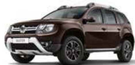
Коричневый металлик MARRON GLACE