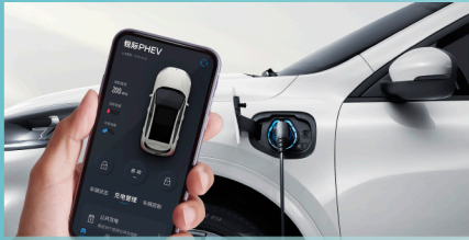
远程控制 皆在掌握