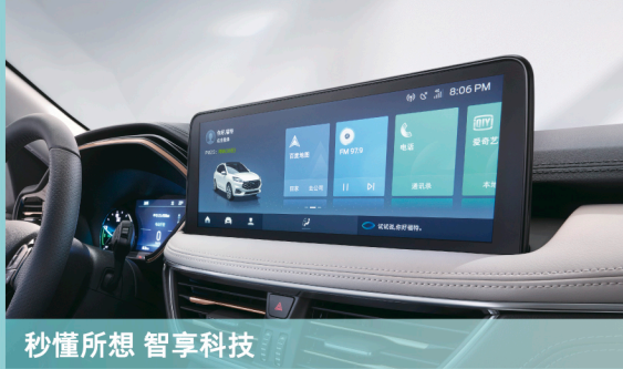
秒懂所想 智享科技

搭载SYNC+® 智行信息娱乐系统，声控互联海量娱乐资源，语音设定多目的地导航，用声音唤醒智慧生活。