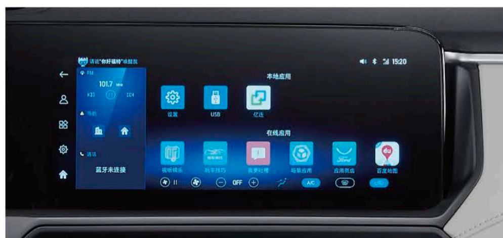
Dolphin系统智慧座舱 领跑业界

12.3寸仪表盘+中控台双联屏, 简洁大气, 拥有视觉震撼的同时, 更带来前所未有的科技智能体验。