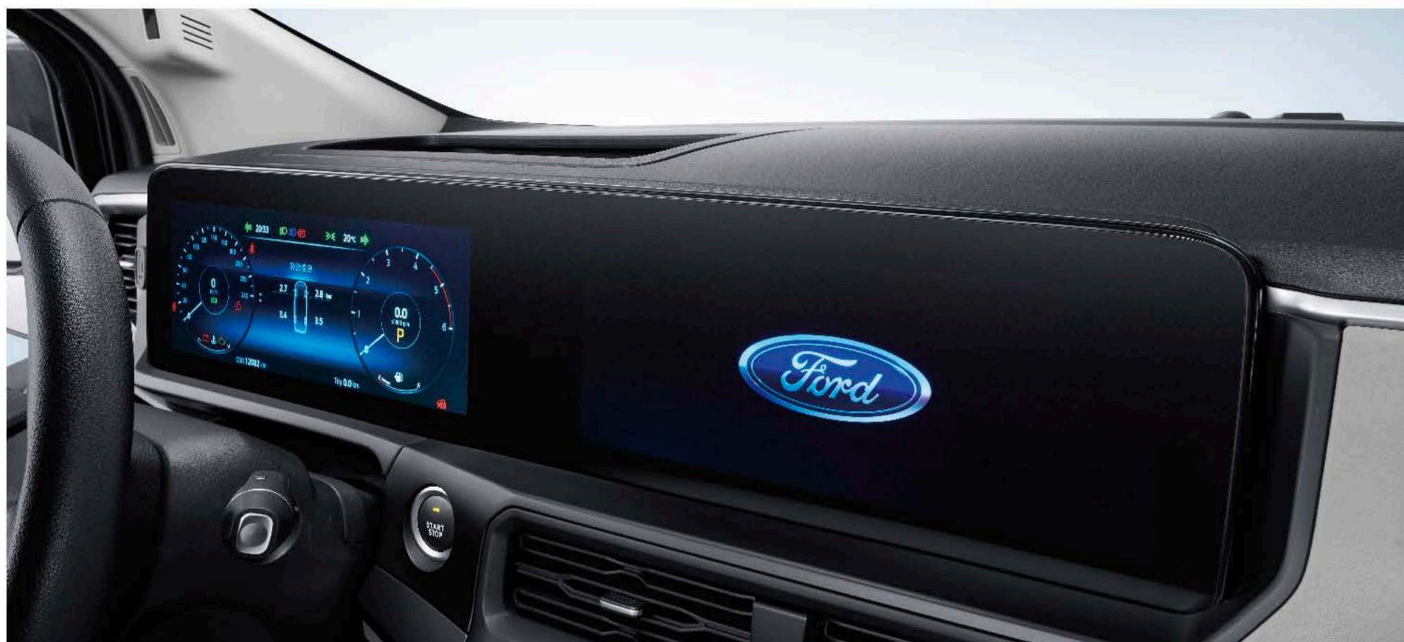
12.3寸双联超大屏 行业唯一

想随时下载海量视听资源? 想拥有沉浸式视听体验? 2023款福特全顺, 满足您的智能出行需求。超级双联屏带来强烈视听震撼, 车机互联, 操作更轻松。数字化服务24小时在线, 智慧出行更轻松!