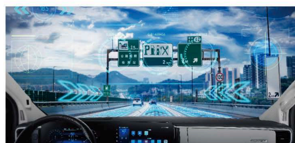
TJA交通拥堵辅助&ICA集成式巡航 行业独有