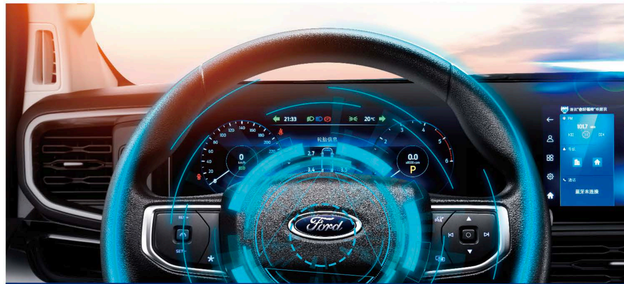
L2级别的ADAS系统 领先同行

面对拥堵也能从容自如, 夜间行车视野依旧清楚。2023款福特全顺, 搭载乘用车级别的安全配置, 解决您的出行担忧。L2级别的ADAS驾驶辅助系统, 搭载MobileEyeQ4芯片, 反应快速精准, 超越同级, 安全一路庇护。