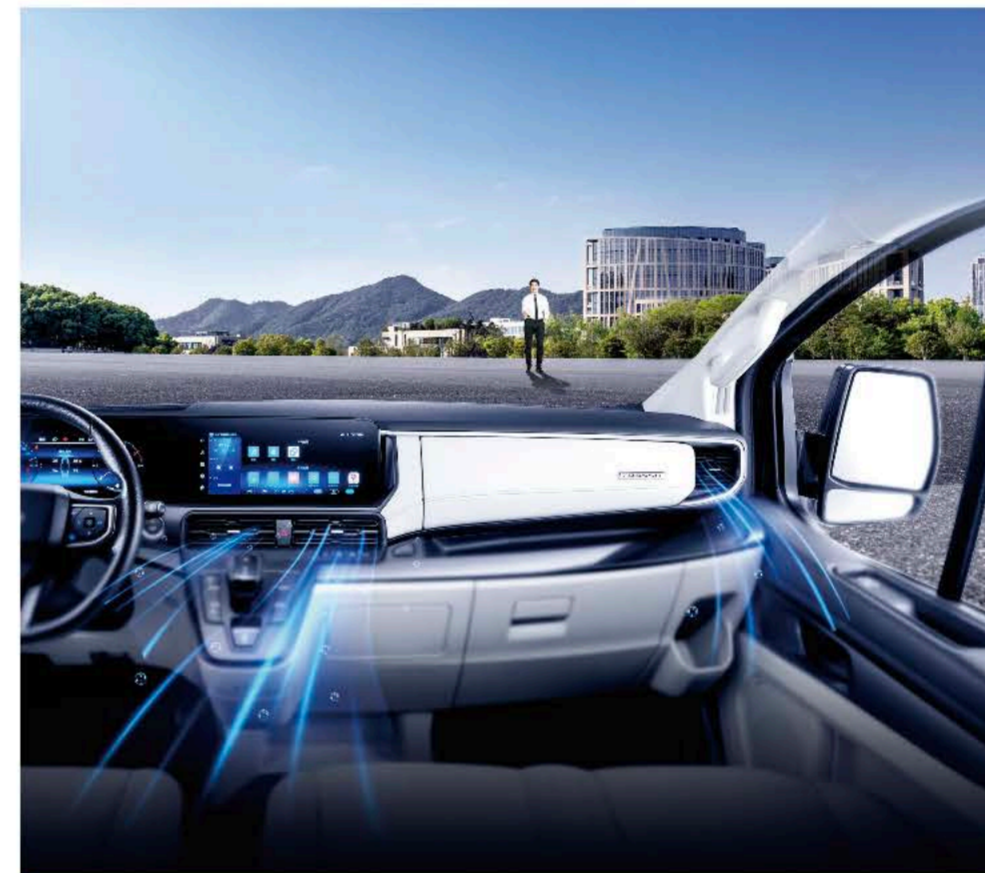
远程空调 即刻清凉