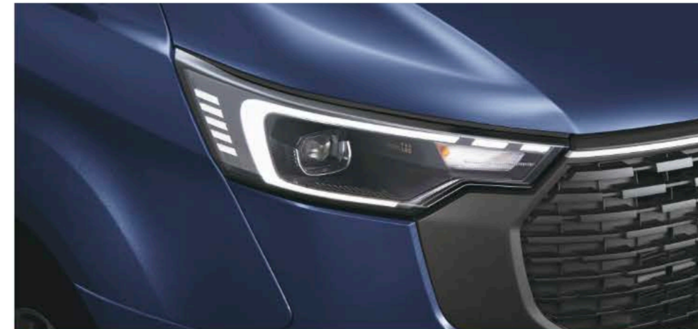
AFS自适应大灯 智能调光

出色科技带来暖心驾乘体验。2023款福特全顺，给你更多安全保护和暖心呵护。智能大灯让视野更清晰可见，64色氛围灯瞬间把气氛打开，想要的仪式感说来就来，倍感精彩。