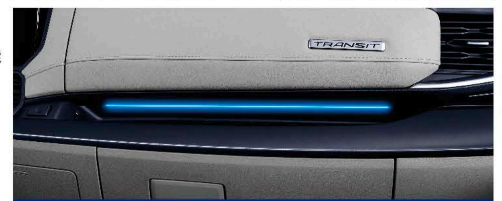
64色可调氛围灯 氛围拉满