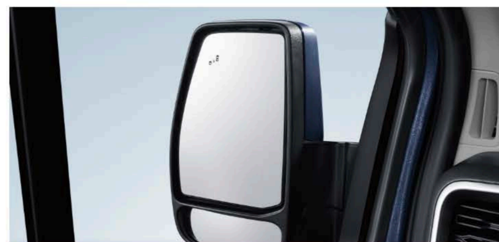
BSD盲点提示&DOW开门预警功能 驾驶安心