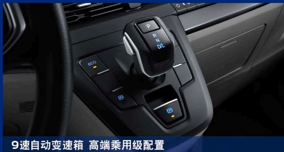
9速自动变速箱 高端乘用车级配置

动力强劲还不费油，夫妻互相换手开，再小的心愿2023款福特全顺都能满足您。柴油&汽油，自动&手动变速箱两种选择丰简由人，满足不同配送需求，加上百公里7.4L的超低油耗，致富路上一路狂飙！