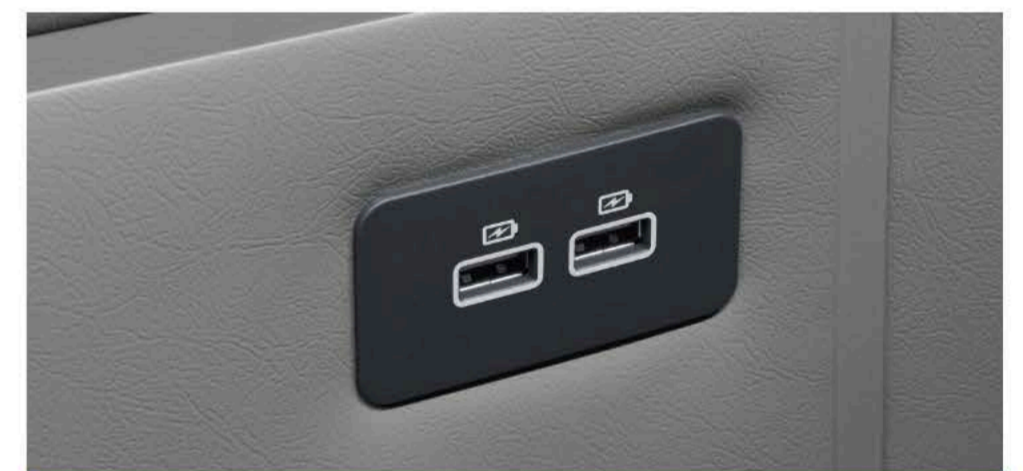
标配USB接口 随时充电