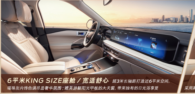
6平米KING SIZE座舱 / 宽适舒心 超3米长轴距打造近6平米空间，瑞珠灰内饰色调尽显奢华氛围；媲美游艇阳光甲板的大天窗，带来独有的日光浴享受