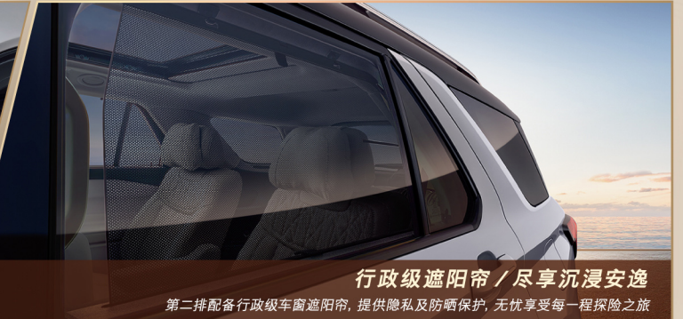
行政级遮阳帘 / 尽享沉浸安逸 第二排配备行政级车窗遮阳帘，提供隐私及防晒保护，无忧享受每一程探险之旅