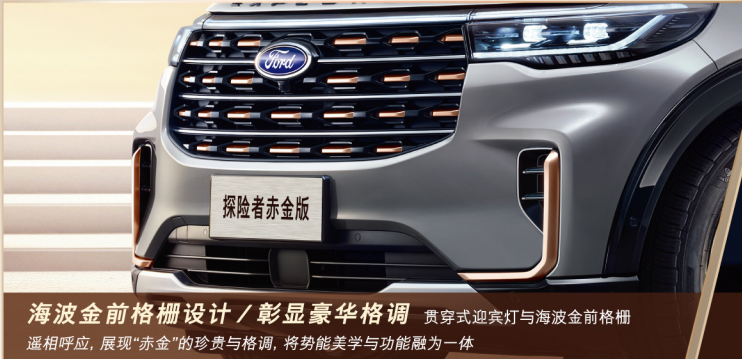
海波金前格栅设计 / 彰显豪华格调 贯穿式迎宾灯与海波金前格栅遥相呼应，展现“赤金”的珍贵与格调，将势能美学与功能融为一体