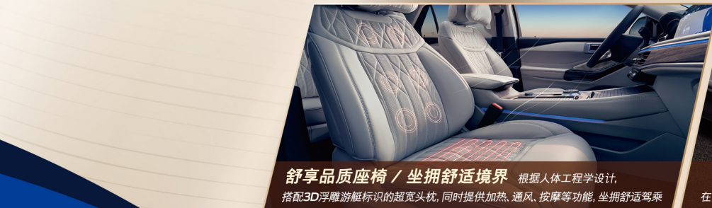
舒享品质座椅 / 坐拥舒适境界 根据人体工程学设计，搭配3D浮雕游艇标识的超宽头枕，同时提供加热、通风、按摩等功能，坐拥舒适驾乘