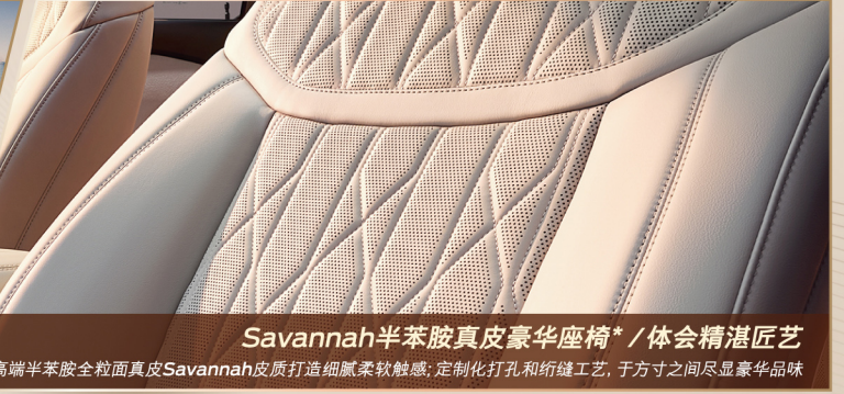
Savannah半苯胺真皮豪华座椅* / 体会精湛匠艺 采用高端半苯胺全粒面真皮Savannah皮质打造细腻柔软触感；定制化打孔和缝线工艺，于方寸之间尽显豪华品味