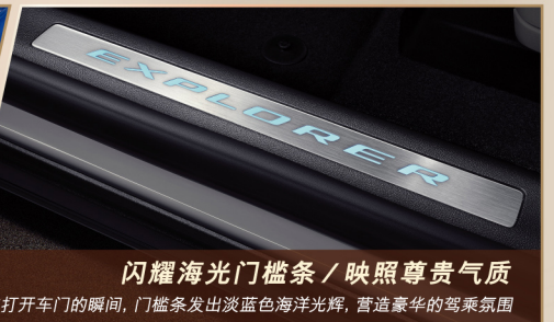
闪耀海光门槛条 / 映照尊贵气质 在打开车门的瞬间，门槛条发出淡蓝色海洋光辉，营造豪华的驾乘氛围