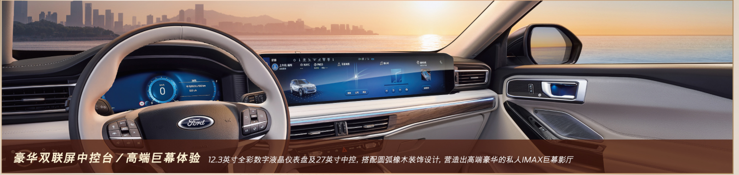
豪华双联屏中控台 / 高端巨幕体验 12.3英寸全彩数字液晶仪表盘及27英寸中控，搭配圆弧橡木装饰设计，营造出高端豪华的私人IMAX巨幕影院