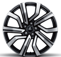
20" EcoBoost® 285赤金版