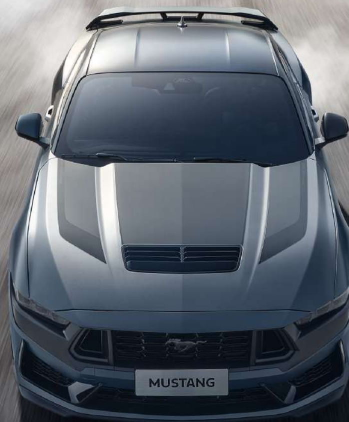
全新 Mustang Dark Horse® 5.0L V8 高性能跑车