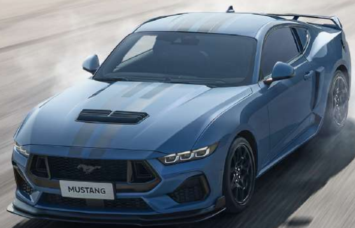
全新 Mustang® 硬顶性能跑车