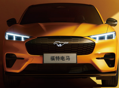
独特的鲨鱼鼻前脸、可点亮的Pony车标 Mustang家族DNA,仪式感拉满。