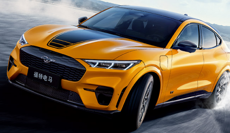
福特首款赛道模拟器调校的量产电车* 基于福特GE1电车平台,传承Mustang性能DNA,车辆响应迅速,路感反馈清晰,车身姿态稳定,拥有赛道基因的精准操控,肾上腺素极速飙升。