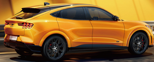
三柱型LED尾灯带流水式转向灯 传承纯正经典Mustang尾灯造型。