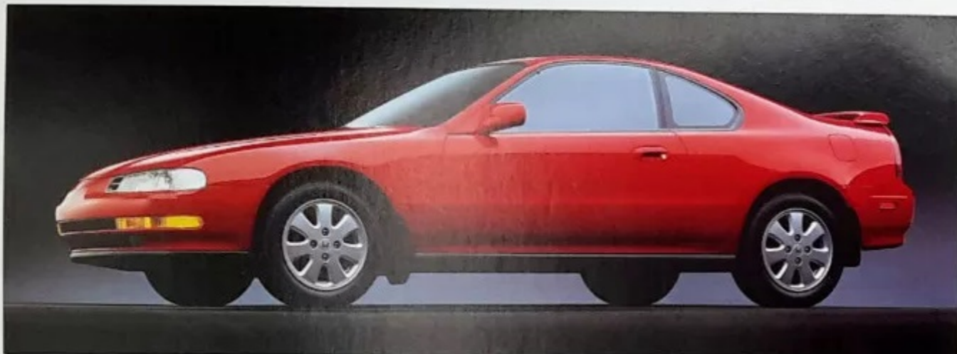
LA PRELUDE 4WS

La Prelude 4WS ainsi que la nouvelle Prelude SR-V, plus musclée, entraînent la performance des Honda vers des sommets jamais atteints.