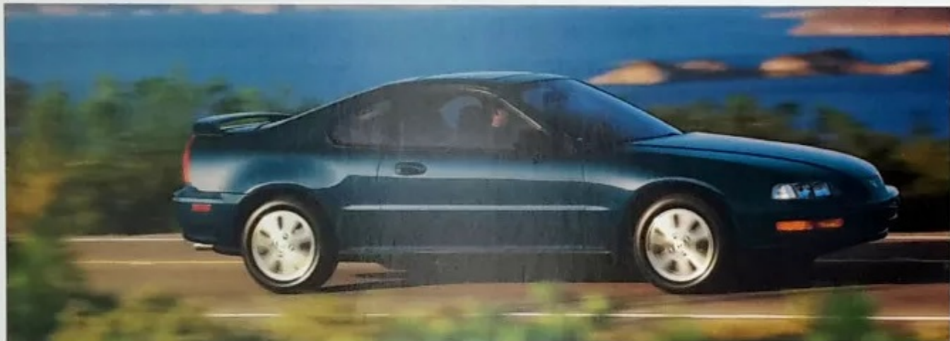
LA PRELUDE SR-V

Grâce à son système à quatre roues directrices, la Prelude 4WS est l'une des voitures les plus maniables et agiles qui puissent réagir avec autant de facilité à vos commandes.