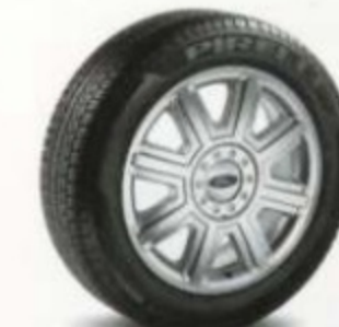
De 18 po à 8 rayons, en aluminium revêtues de chrome Livrables pour SEL et Limited