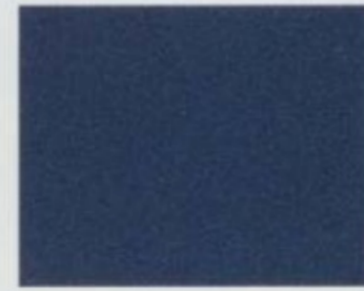
Bleu nacré foncé métallisé