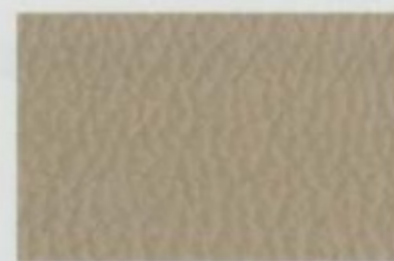
Cuir galet De série pour Limited, livrable pour SEL