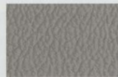
Cuir argile Livrable pour SEL