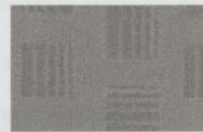
Tissu argile De série pour SEL