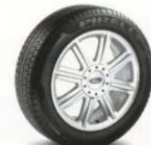
De 18 po à 8 rayons, en aluminium brillant De série pour Limited