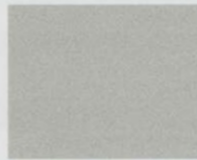
Bouleau argenté métallisé