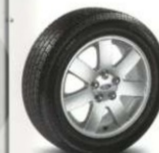
De 17 po à 7 rayons, en aluminium De série pour SEL