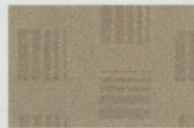
Tissu galet De série pour SEL