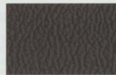
Cuir noir De série pour Limited