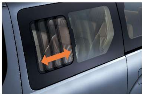
□ 可開啟式側滑窗 (旗艦型)