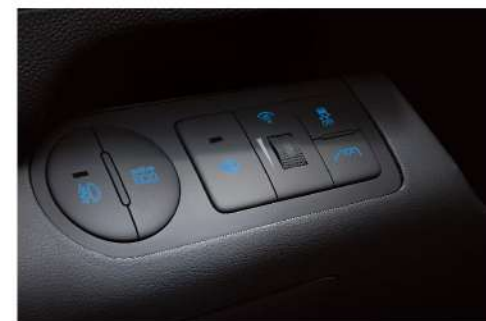
□ 後霧燈開關/頭燈水平調整

1. 規格配備以實車為準，現代汽車引進各種車型，請參考規格配備表，或洽詢各地經銷商。2. 本公司保留產品規格與配備修改之權利。