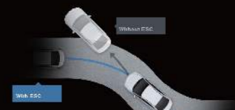
■ ESC 電子車身穩定系統