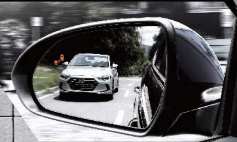
■ BSD 盲點偵測警示系統