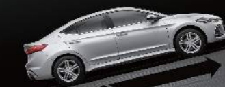
■ HAC 上坡起步輔助系統