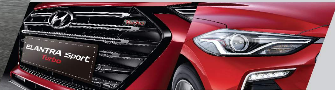
■ 煙黑雙色六角形前氣壩 / 專屬 Turbo 銘板