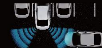
■ RCTA 後方交通警示系統