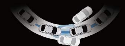
■ VSM 整合式車身動態管理系統