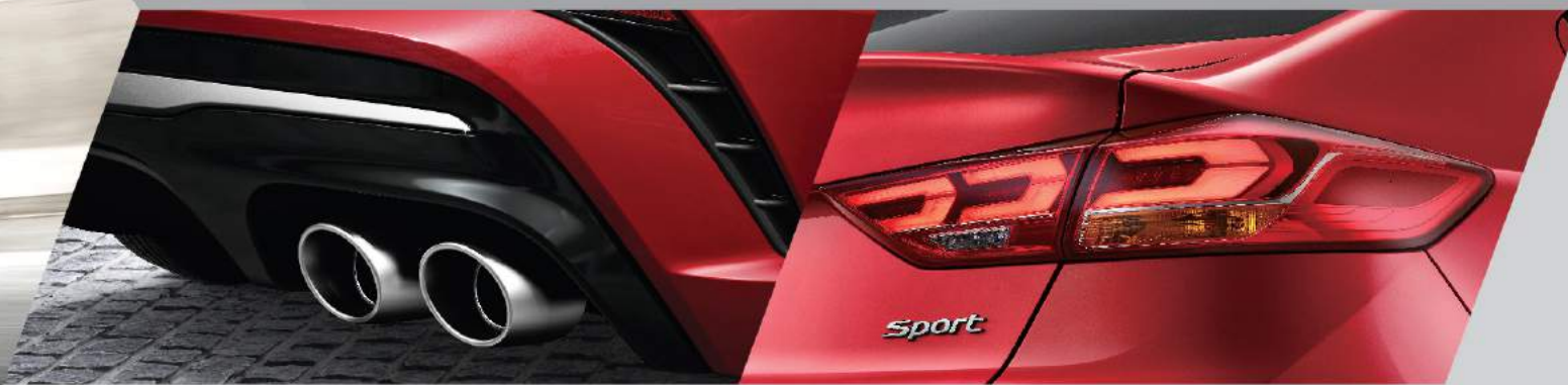
■ 賽道化雙出鍍鉻尾管 / 後下擾流分流設計