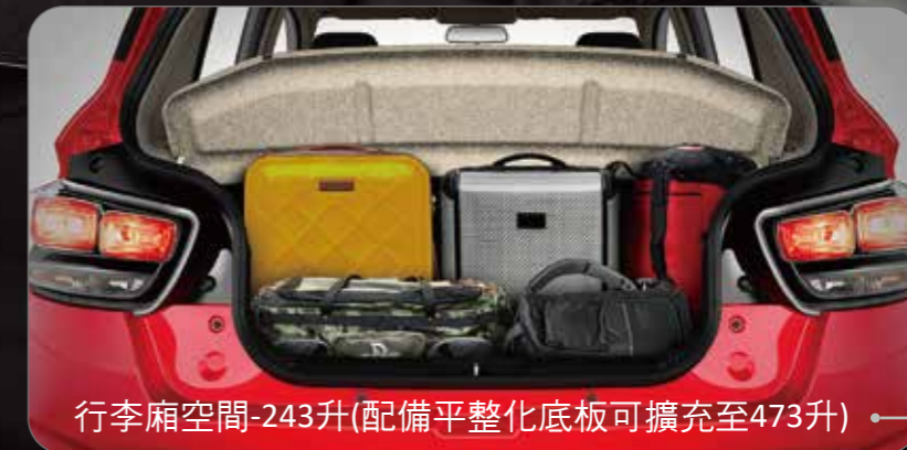
行李廂空間-243升(配備平整化底板可擴充至473升)