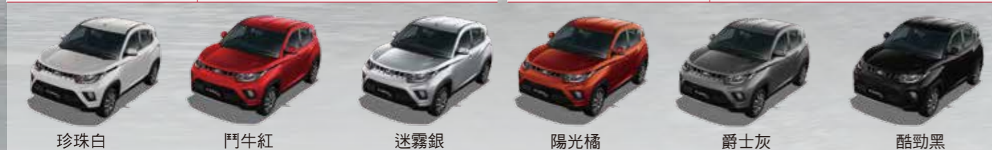
珍珠白 鬥牛紅 迷霧銀 陽光橘 爵士灰 酷勁黑

並非所有車款都有提供所有配備或顏色選擇 / 所示的配件並非標準裝備之一 / 實際性能表現可能與測試時狀況不同而有差異 / 車體顏色可能與印刷色調不同 / 依據產品持續改進政策, 我們保留更改規格或設計時不事先通知也不負責之權利 / 請與經銷商詳細確認款式