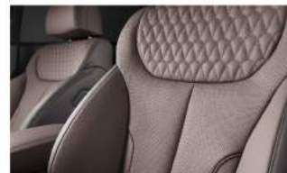
高級鑽石紋真皮座椅