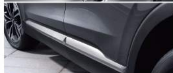
鍍鉻窗框 鍍鉻車側飾條