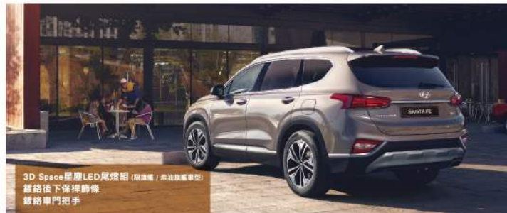
3D Space 星塵 LED 尾燈組 (限旗艦 / 典藏旗艦車型) 鍍鉻後下保桿飾條 鍍鉻車門把手