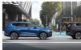
LVDA 前車駛離提醒系統