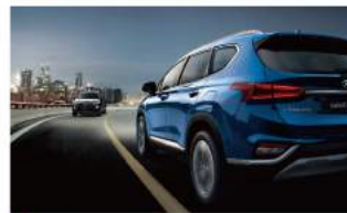
HBA 智慧型遠近光燈調節系統