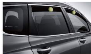
四門單觸式車窗啟閉 (附防夾機制)