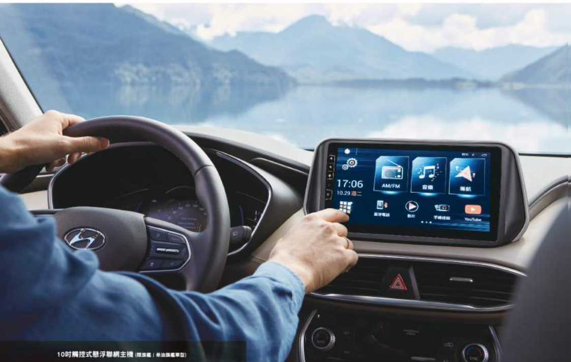
10吋觸控式懸浮聯網主機 (限旗艦 / 榮冠旗艦車型)