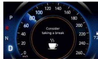
DAW 駕駛疲勞警示系統

*本廣告顯示為國外當地販售之車型，台灣市售車型以VSCC圖說為準。 *各車型之功能配備請以實車為準。 *電子配備均有自動之條件，請詳閱車主手冊。