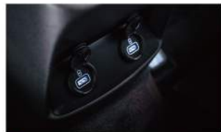
Easy-Charge 第二排雙 USB 充電座 & 置物盒