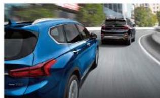
SCC 智慧型主動車距維持系統 (附 Stop & Go)