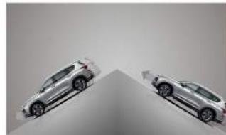
DBC 陡坡緩降輔助系統 HAC 上坡起步輔助系統