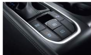
EPB 電子式手煞車 Auto Hold 自動駐車系統