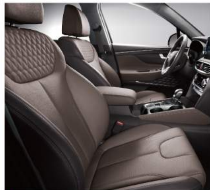
深層抒壓雙前座椅