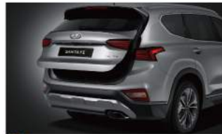
Easy-Adjust 開啟速度 & 高度可調感應式電動尾門 (限旗艦 / 柴油旗艦車型)