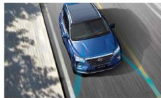
LDW 車道偏移警示系統 LKA 車道偏移輔助系統