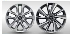
17吋五輻雙動式鋁圈 18吋五輻旋葉式鋁圈

*本廣告所示為國外市場販售之車況，台灣市場車款以V600雙驅合身為準。 *各車型之規格以圖說及實車為準。