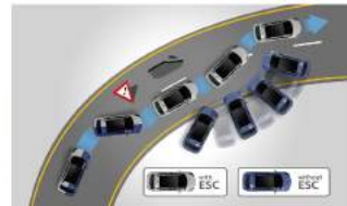
ESC 電子車身動態穩定系統 VSM 整合式車身動態管理系統 (附自動轉向修正)