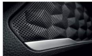
鑽石印象揚聲器立體飾板