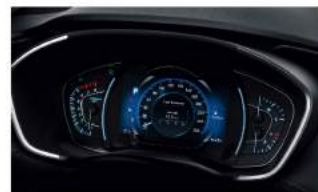
7" TFT-LCD 全彩高解析度數位儀表 (限旗艦 / 榮冠旗艦車型)