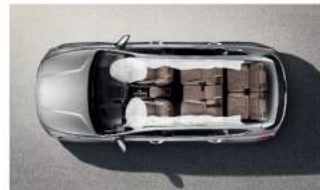
全車標配6具 SRS 輔助氣囊

最好的守護是時時保護。除了Hyundai SmartSense全智能先進安全科技，更以最高標準通過多項世界撞擊測試，全車標配6具SRS輔助氣囊及多項安全輔助系統，提供超越同級的安全守護。與家人一起的每趟旅程，安全始終隨行守護。