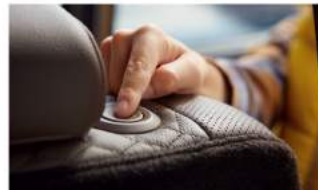
Easy-Touch 第二排快速前傾進出裝置

直覺的 Easy System，讓您陪伴家人出遊，輕鬆符合各種乘坐人數需求，不論是同級唯一的 Easy-Touch 第二排快速前傾進出裝置，或是 Easy-Fold 第二排座椅電磁閥釋放鈕，大空間任意變換，給家人最便利的乘坐感受。