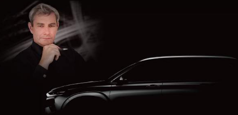
Luc Donckerwolke 現代汽車集團設計總監