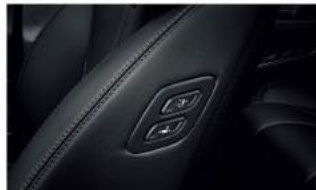
Easy-In 電動調整迎賓副手座 (限旗艦 / 柴油旗艦車型)