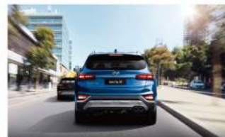
FCW 前方撞擊警示系統 FCA 前方主動煞停輔助系統 (當行人偵測)