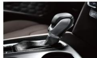
高級真皮包覆方向盤 & 排檔頭