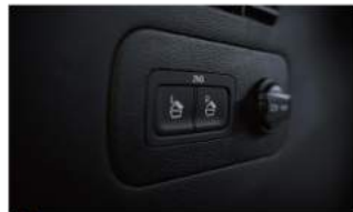
Easy-Fold 第二排座椅電磁閥釋放鈕

*本圖也顯示為國外當地販售之車型，台灣市售車型以VOCV實物為準。 *各車型之規格配置請以實車為準。