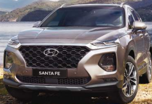
金屬黑鍍鉻前氣壩 鍍鉻式 LED 日行燈

霸氣獨特姿態，光存在就是一道美景。大器歐系高質成設計與精練車側線條，創造出前後各具魅力的肌理外觀。再搭配新世代分離式頭尾燈設計，一現身即是眾人目光焦點。