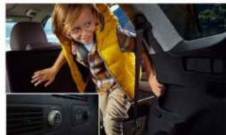
Easy-Hold 人體工學第三排進出握把 / 扶手 第三排空調系統 (限旗艦 / 柴油旗艦車型)