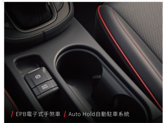
/ EPB 電子式手煞車 / Auto Hold 自動駐車系統