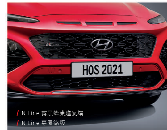
/ N Line 霧黑蜂巢進氣壩 / N Line 專屬銘版