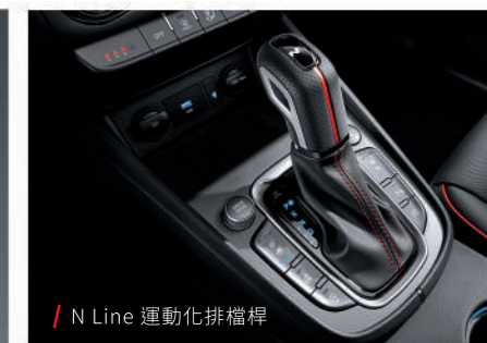
/ N Line 運動化排檔桿