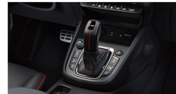
/ 七速DCT雙離合器自手排

搭載全新第二代七速 DCT 雙離合器自手排變速系統 提供等同歐系鋼砲的駕馭感受 兼顧省油與環保需求