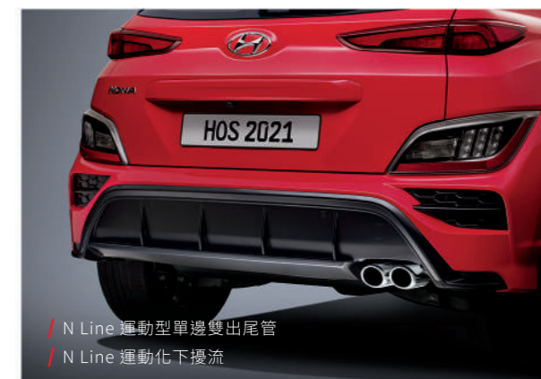
/ N Line 運動型單邊雙出尾管 / N Line 運動化下擾流