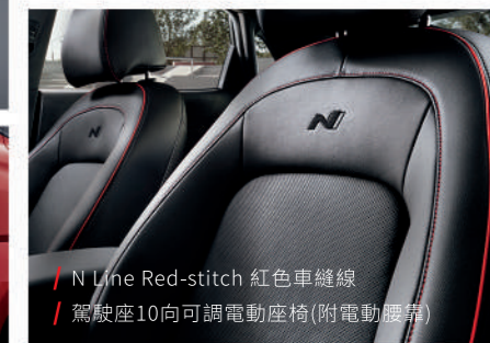
/ N Line Red-stitch 紅色車縫線 / 駕駛座10向可調電動座椅(附電動腰靠)