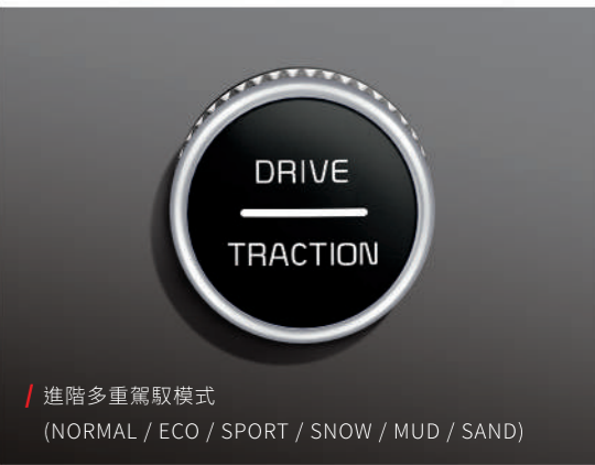
/ 進階多重駕駛模式 (NORMAL / ECO / SPORT / SNOW / MUD / SAND)