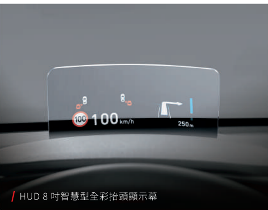
/ HUD 8 吋智慧型全彩抬頭顯示幕