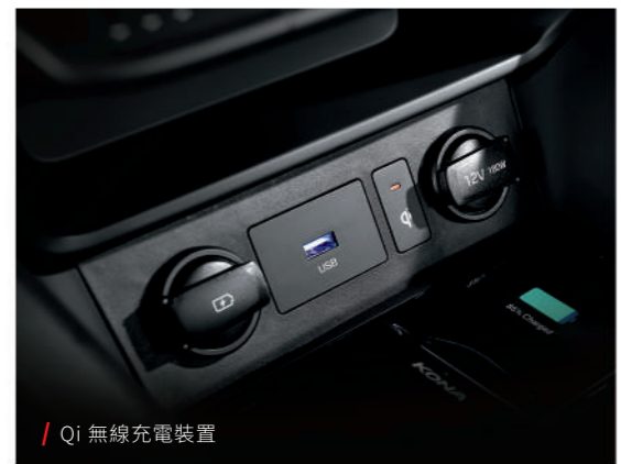
/ Qi 無線充電裝置