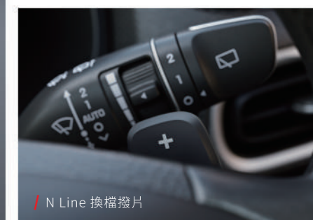
/ N Line 換檔撥片