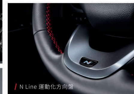
/ N Line 運動化方向盤