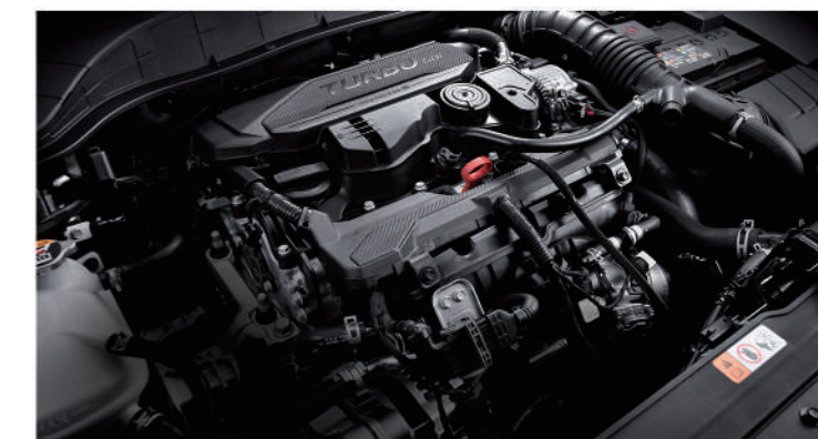
/ 全新Hyundai SmartStream 渦輪增壓引擎 CVVD連續可變汽門持續系統

*本廣告展示為國外當地販售之車型, 台灣市售車型以VSCC審驗合格為準 *各車型之規格配備請以實車為準