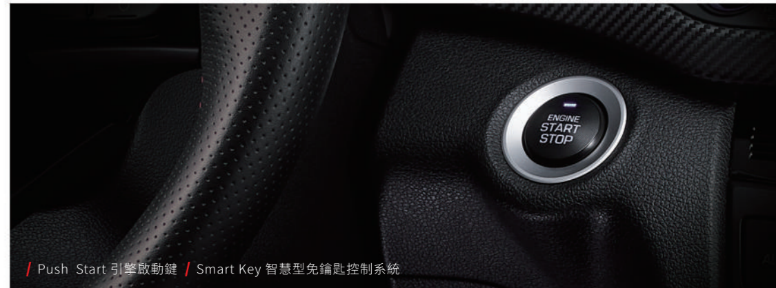
/ Push Start 引擎啟動鍵 / Smart Key 智慧型免鑰匙控制系統