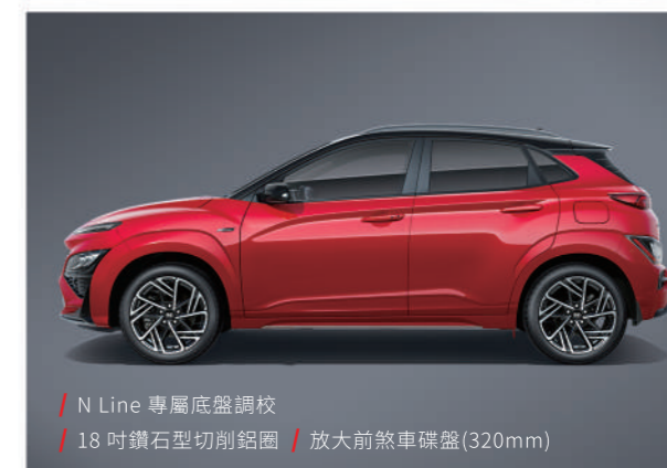
/ N Line 專屬底盤調校 / 18吋鑽石型切削鋁圈 / 放大前煞車碟盤(320mm)