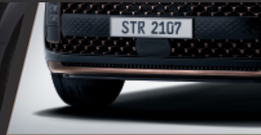
玫瑰金水箱護罩、下保險桿