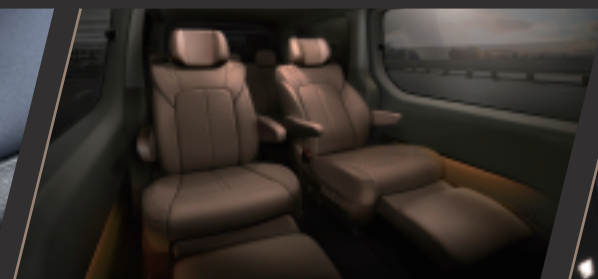
第二排座椅仰躺功能