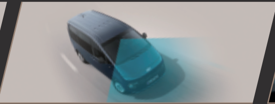
LFA 全速域車道維持輔助