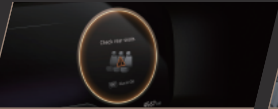
ROA 後座乘員未下車警示