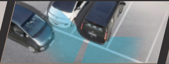
RCCA 後方交通防撞輔助