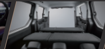
全平整傾倒（第二及第三排）