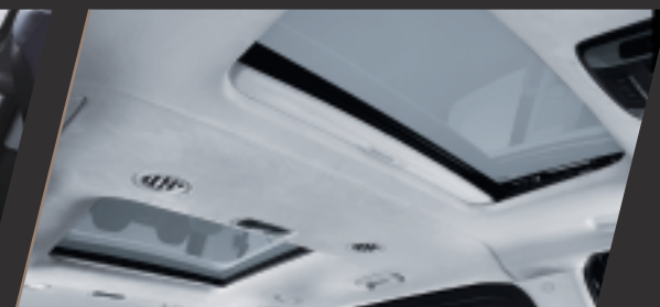
類麂皮頂棚 / 雙電動玻璃天窗 / 二三排獨立恆溫空調系統