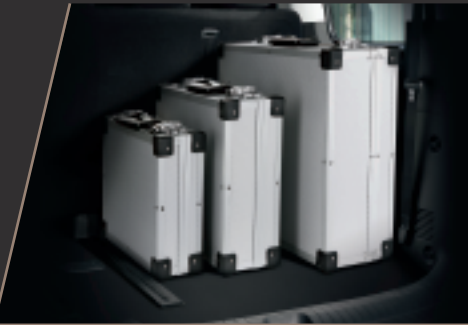
最大1,303L行李廂空間 / 長滑軌前後挪移（第二及第三排）