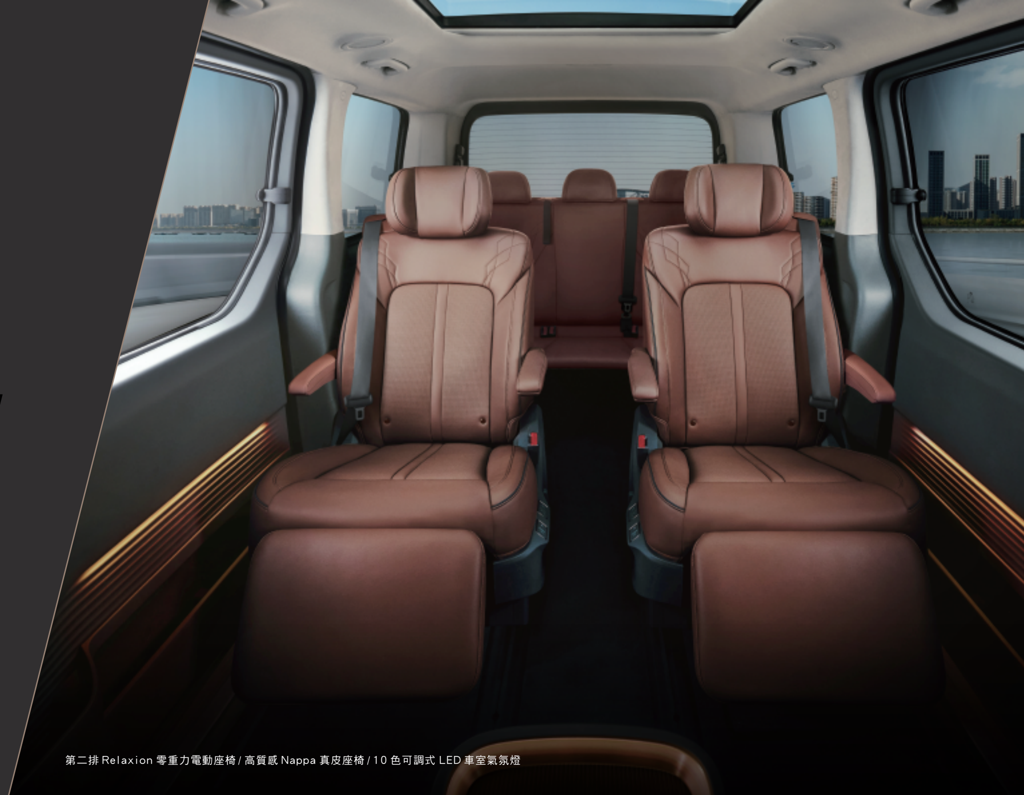
第二排 Relaxion 零重力電動座椅 / 高質感 Nappa 真皮座椅 / 10 色可調式 LED 車室氣氛燈