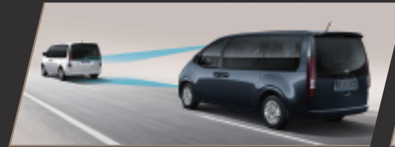
SCC 智慧型主動車距維持 (附 Stop & Go)

搭載 SmartSense 全智能先進安全科技 在駛向嶄新視野的道路上 為車主及所有貴賓全方位護航