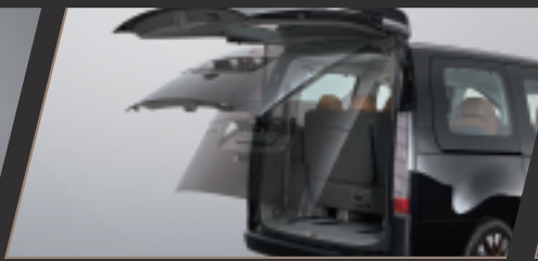
Smart Trunk 智慧電動尾門 (高度可調 / 感應式開關)