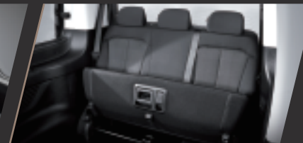
椅墊向上收摺（第三排）