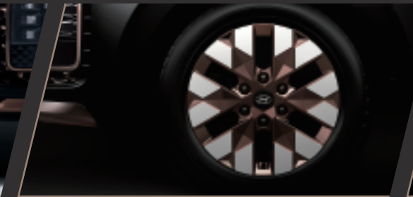
玫瑰金18吋幾何切削鋁圈