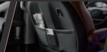
第二排前方椅背掛勾 地圖袋及專屬手機袋