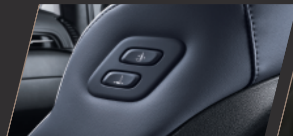
Walk-in Button 副駕駛座 側面調整快捷按鈕