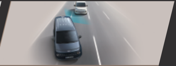
BCA 盲區碰撞避免輔助