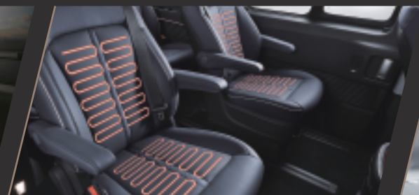
前排、第二排座椅通風及加熱功能