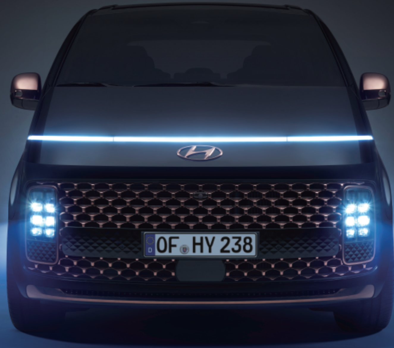
橫貫式LED日行定位燈