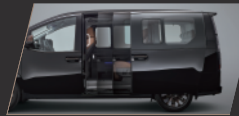
雙側智慧電動滑門 (附感應及遙控開啟功能)