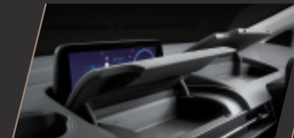
儀表前方及中控台上方置物盒