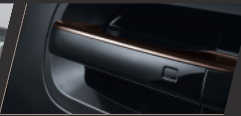
Smart Key 智慧型免鑰匙車門啟閉控制 / Push Start 引擎啟動鍵