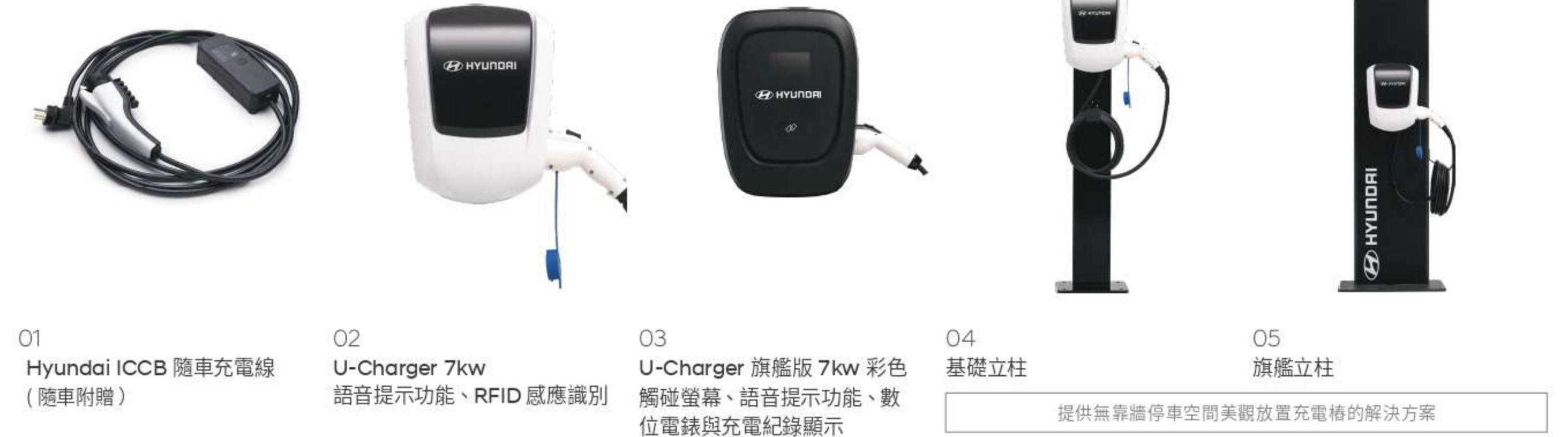
01 Hyundai ICCB 隨車充電線 (隨車附贈)

Hyundai 為您提前佈建電動車未來，隨車亦附贈 Hyundai 原廠行動充電線。抵達住家，停車之後直接插上電源，純電生活如此簡單。Hyundai 與全台最大充電設備廠商「Yes!來電」合作，提供到府協助勘查，判斷住家條件是否適合安裝家用充電樁。