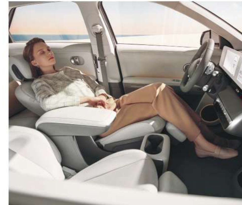
雙前座尊榮型全傾倒 12 向電動座椅(附加熱/通風功能) 第二排前後滑移/角度可調式座椅