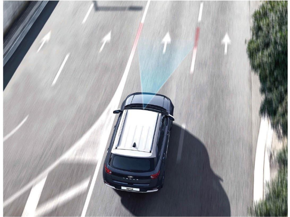
LKA 車道偏移輔助系統 / LDW 車道偏移警示系統