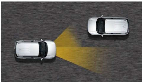
HBA 智慧型遠近光燈調節系統