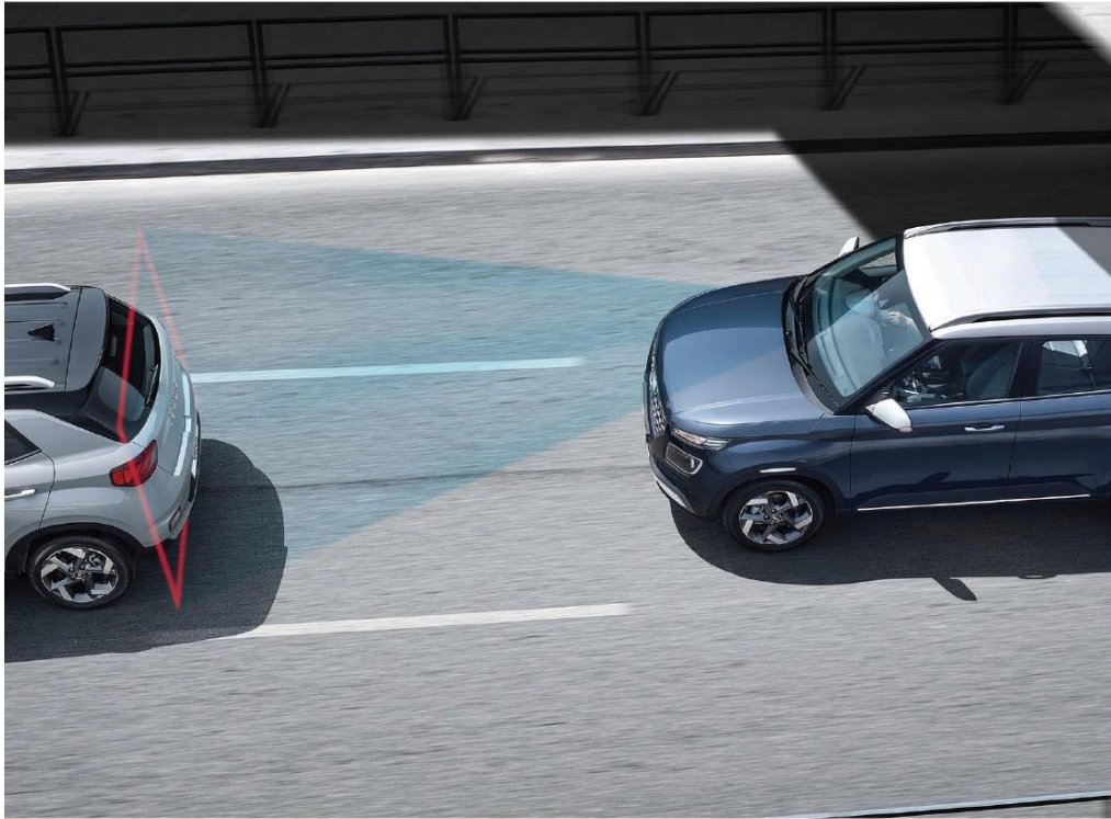
FCA 前方主動煞停輔助系統 [含行人偵測] / FCW 前方撞擊警示系統