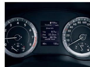
雙環式儀表 / 3.5吋TFT-LCD車資顯示幕