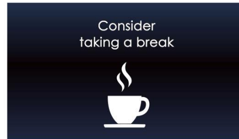
DAW 駕駛疲勞警示系統