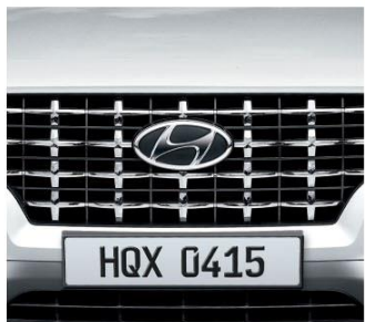
十字鍍鉻水箱護罩 [Mono-tone 單色專屬]