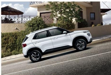
HAC 上坡起步輔助系統

62% 高剛性鋼材 [46% AHSS先進高剛性鋼材+16% HSS高剛性鋼材]