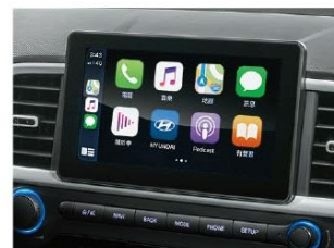
8吋觸控懸浮式影音系統 [附Apple CarPlay™]