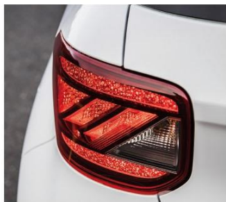
緋紅星辰 LED 尾燈