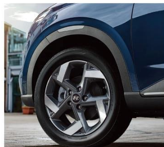
17吋雙色切削五輻鋁圈

※本型錄展示之車色、樣式、規格及配備為GLC型，僅供參考，臺灣市售車型以VSCC審驗合格及實際購車之規格為準。