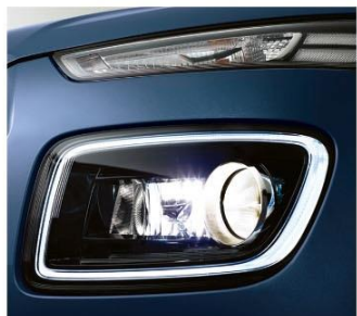
分離式頭燈設計 / LED 日行光環 [附轉向輔助照明]