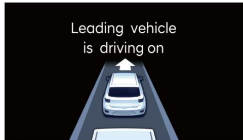
LVDA 前車駛離提醒系統