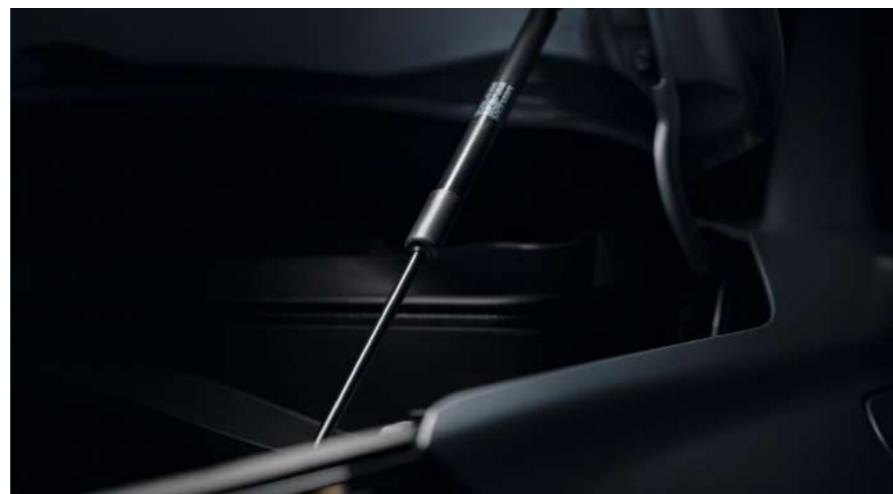
Газовые упоры капота