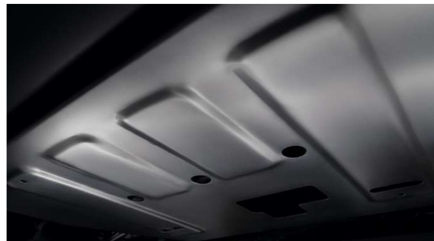
Стальная защита картера двигателя