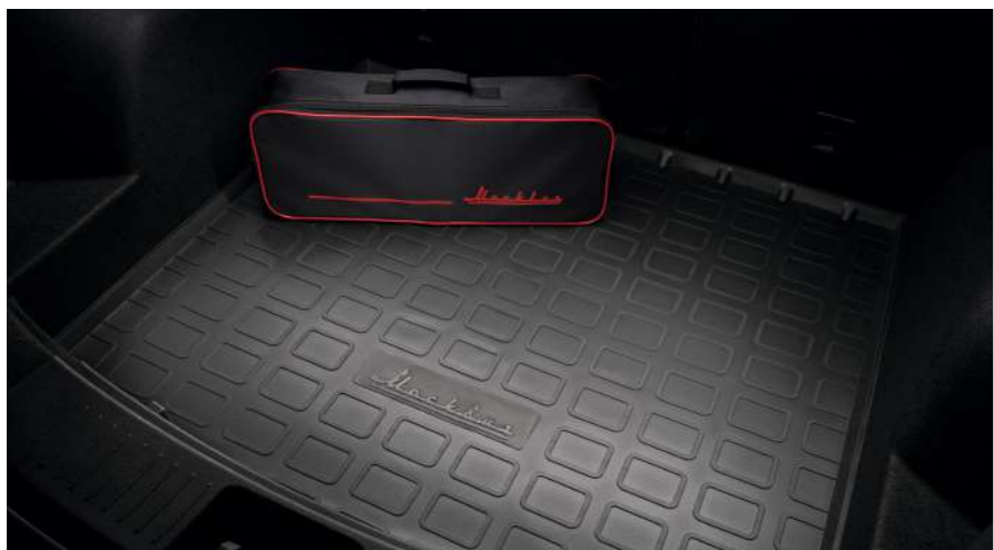
Поддон в багажник