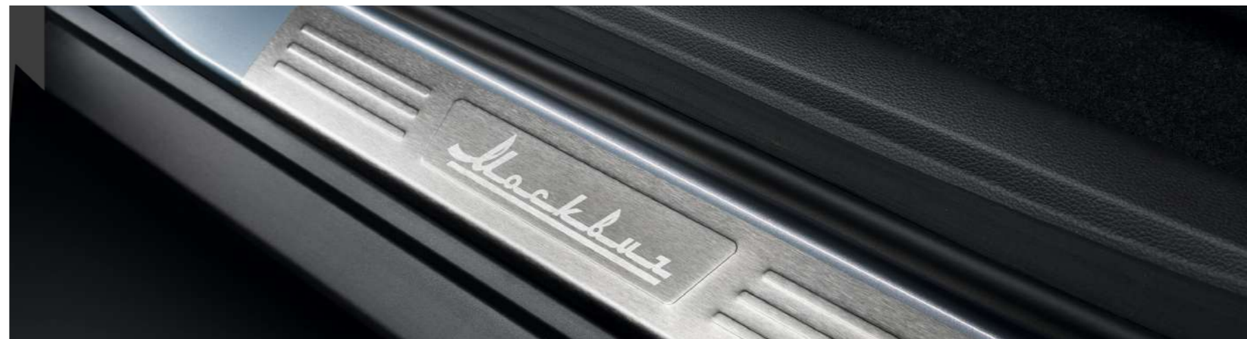
Накладки на пороги