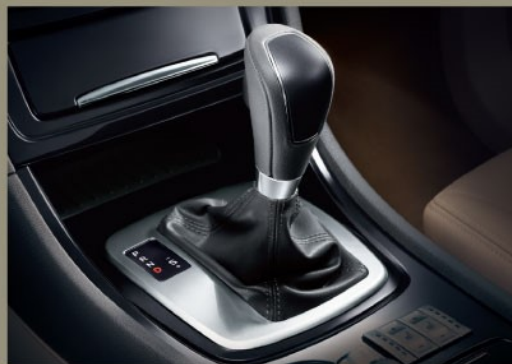
6速手/自动一体变速器

蒙迪欧-致胜2.3L时尚型、豪华型和豪华运动型均配备此款发动机,采用全铝合金本体以及双反置平衡轴设计,可变进气凸轮正时,IMRC可变进气道装置、可变进气涡流控制阀等先进技术的运用,使发动机在拥有澎湃动力的同时,更能保证低油耗、低排放和最大的稳定性以及耐久性。