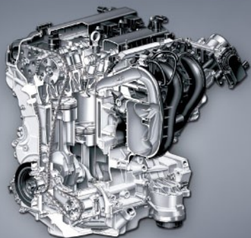
2.3L Duratec-HE 发动机

蒙迪欧-致胜2.3L时尚型、豪华型和豪华运动型均配备此款发动机,采用全铝合金本体以及双反置平衡轴设计,可变进气凸轮正时,IMRC可变进气道装置、可变进气涡流控制阀等先进技术的运用,使发动机在拥有澎湃动力的同时,更能保证低油耗、低排放和最大的稳定性以及耐久性。