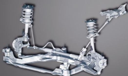
前独立麦弗逊式悬挂

蒙迪欧-致胜所有2.3L车型均配备全新6速手自一体变速器,驾驶员可根据驾驶习惯和道路状况随意进行切换,将自动挡的便捷与手动换挡的乐趣完美融合,充分享受驾控乐趣。