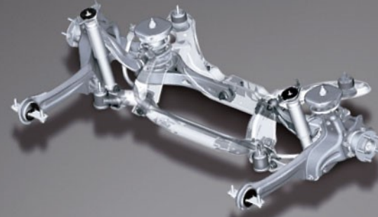
复合连杆式后悬挂

底盘前端的麦弗逊压杆辅以横向稳定平衡杆的设计,能够更为有效地提高刹车的稳定性、噪音的阻隔性,全面提升乘坐舒适性。