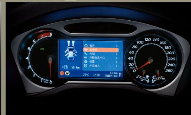
仪表盘彩色液晶屏综合信息显示系统

带上钥匙进入驾驶舱,踩下刹车踏板,同时按下"Ford Power"启动按钮,引擎即被启动。