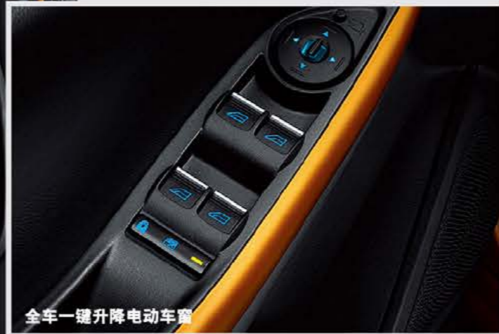
全车一键升降电动车窗