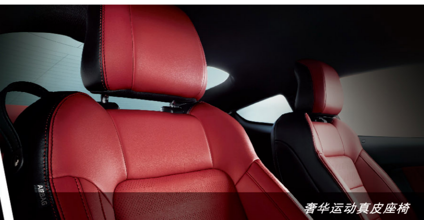
奢华运动真皮座椅