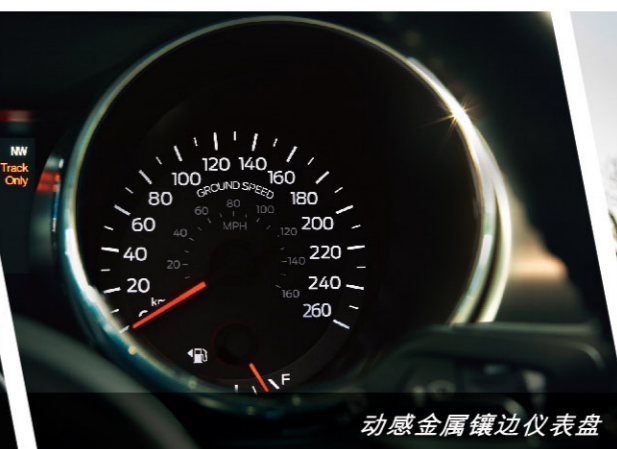
动感金属镶边仪表盘