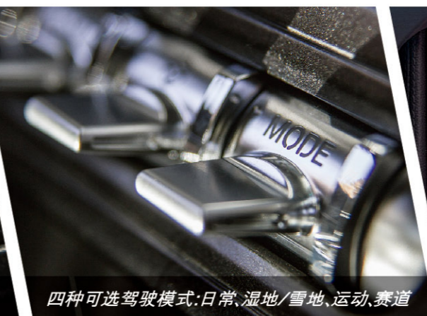
四种可选驾驶模式:日常、湿地/雪地、运动、赛道