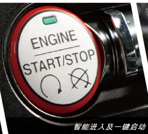
智能进入及一键启动