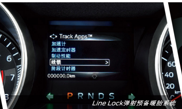
Line Lock弹射预备暖胎系统