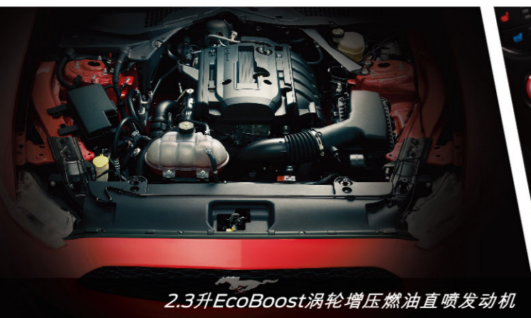
2.3升EcoBoost涡轮增压燃油直喷发动机

全新Mustang为驾驶者提供强劲2.3升EcoBoost涡轮增压燃油直喷发动机和闻名于世的经典5.0升V8发动机,同时配备带有手动换挡拨片的六速手自一体变速器以及四种驾驶模式,让拥有驾驭天分的你尽情释放心中的本能。全面升级的SYNC®车载连接系统, Line Lock弹射预备暖胎系统和Track Apps赛道应用程序等高端智能科技带给你无与伦比的驾驶乐趣。