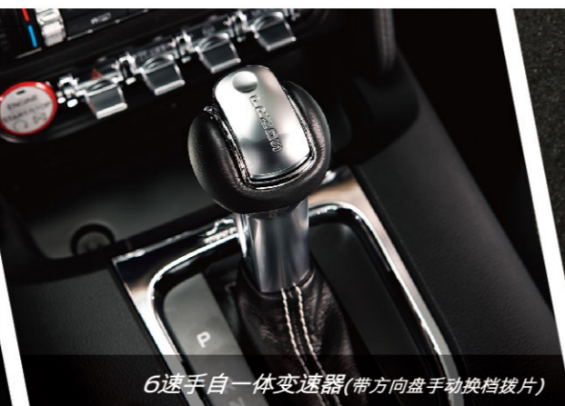
6速手自一体变速器(带方向盘手动换挡拨片)