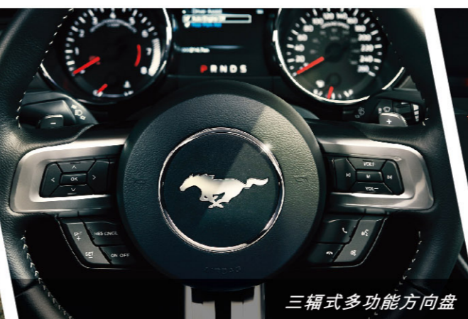
三辐式多功能方向盘