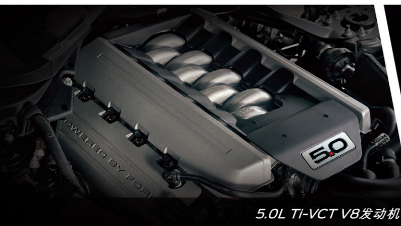
5.0L Ti-VCT V8发动机

愈难驯服,愈想征服。自诞生起,传奇肌肉跑车Mustang便成为无数狂放不羁者的野性座驾。 全新Mustang V8 GT,搭载Mustang强悍的5.0L TiVCT自然吸气发动机,释放出狂野的磅礴动力。Line Lock弹射 预备暖胎系统和Brembo高性能制动系统等高级跑车的配备,超越你对驾驭的所有渴望。