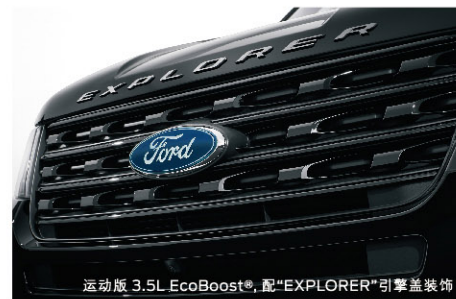
运动版 3.5L EcoBoost®, 配“EXPLORER”引擎盖装饰

自带脚部感应功能的电动尾门,无需动手,只要用脚在后保险杠下晃动,便可自动开启后备箱,举手投足尊崇尽显。