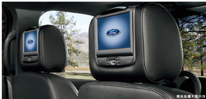
精英版豪华黑内饰

前排10向电动调节真皮座椅, 带加热制冷及按摩功能 (并非适用所有车型, 详询当地经销商) 前排座椅10向电动可调, 并带有电动腰靠调节及按摩功能, 为您消除旅途疲劳, 缓解压力, 带来舒适“椅”靠。人性化的驾驶员座椅带记忆储存功能, 懂您所需。前排座椅的加热或制冷功能, 给您全程舒适的乘坐体验。