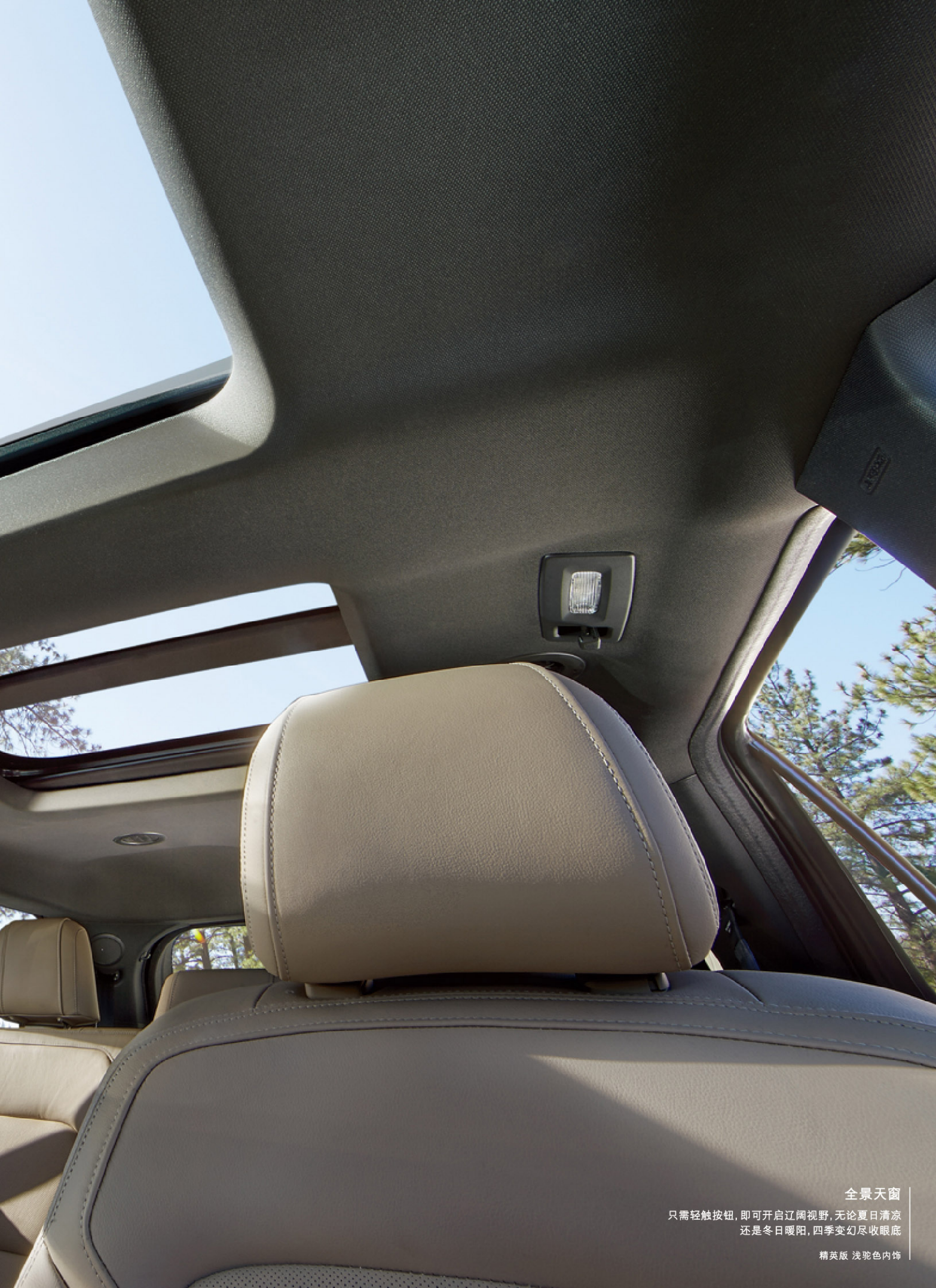
全景天窗 只需轻触按钮,即可开启辽阔视野,无论夏日清凉 还是冬日暖阳,四季变幻尽收眼底 精英版 浅驼色内饰