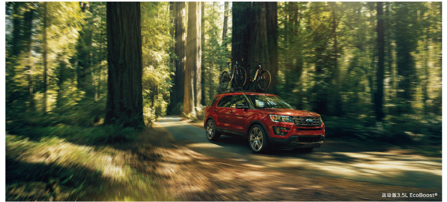
运动版 3.5L EcoBoost®