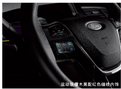
运动版橡木黑配红色缝线内饰

前排双头枕DVD播放器 (选装包) 为后排乘客提供高端的车内影音娱乐体验, 让您的旅途生活收获不间断的缤纷娱乐和欢声笑语。