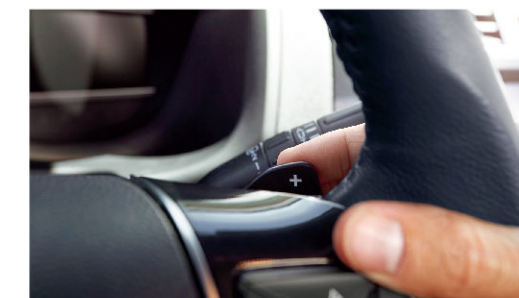
6速SelectShift®手自一体变速器,带换挡拨片

3.5L V6 EcoBoost®和2.3L I4 EcoBoost®缸内直喷涡轮增压引擎 3.5L V6 EcoBoost®在诞生初年就荣膺沃德全球十佳发动机。搭载在新福特探险者上的该发动机输出最大功率262千瓦,峰值扭矩501牛·米,爆发浩瀚动力,一路所向披靡。2.3L I4 EcoBoost®发动机最大功率203千瓦,峰值扭矩410牛·米,带来出色的燃油表现以及远超预期的动力。