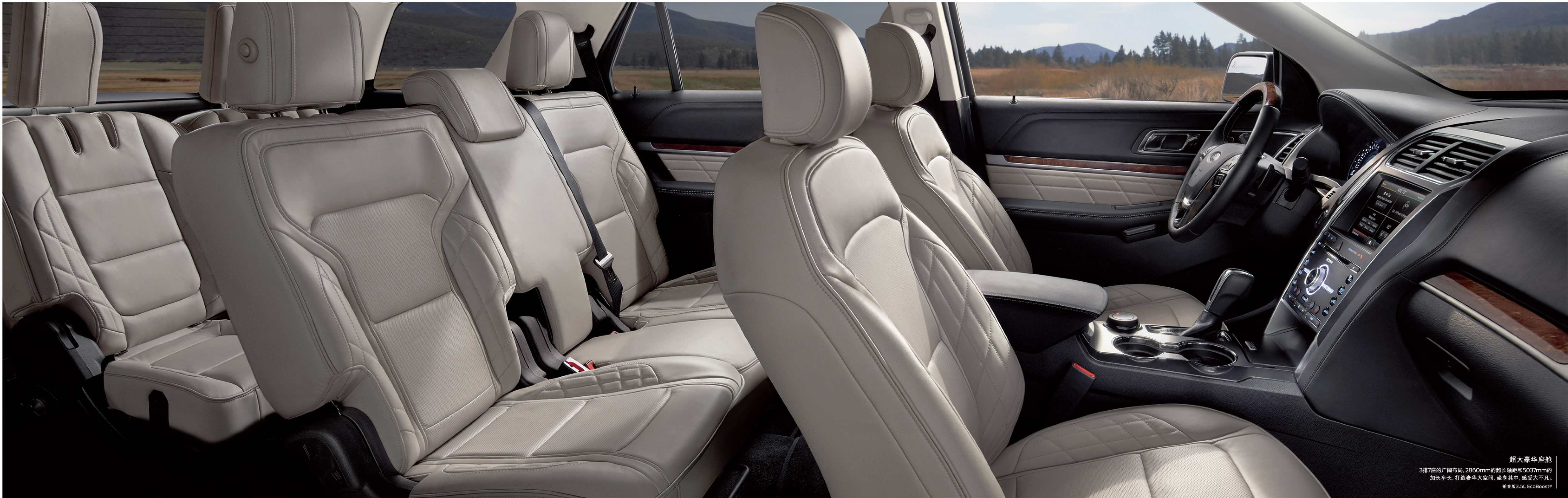
超大豪华座舱 3排7座的广阔布局, 2860mm的超长轴距和5037mm的加长车长, 打造奢华大空间, 坐享其中, 感受大不凡。 铂金版3.5L EcoBoost®