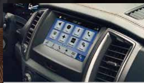
4.2英寸液晶仪表盘及8英寸LCD彩色中控屏 4.2英寸液晶仪表盘可自由选择车辆设置显示； 8英寸LCD彩色中控屏整合多元系统，连通随身设备。

跋山涉水，却不把舒适留在千里之外，于细节跃然呈现。独特的纹理为动感色彩组合丰富了视觉层次，精致的面料缝制工艺带来柔软触感，配合贯穿整个驾驶舱前舱的科技感线条，让你置身其中便尽享感官盛宴。