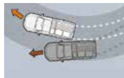
- ALC主动式负载控制系统