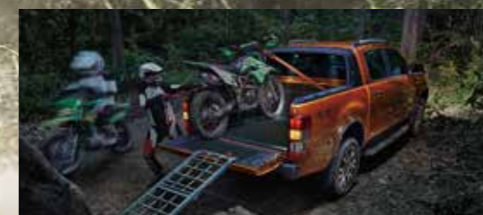
强悍拖曳承重能力 3.5吨拖曳能力和1吨承重能力，优异数据充分展现粗犷本性。