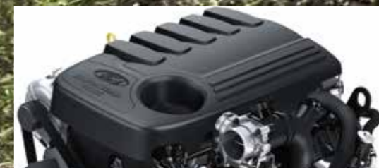
3.2L TDCi直喷式五缸涡轮增压发动机 可爆发出强悍马力和超高扭矩，拥有低转速大扭矩输出。