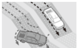
- HDC陡坡缓降辅助系统