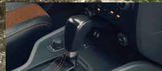
6速手自一体变速箱 手动自动一体化，享受手动换挡的操控感和自动换挡的舒适感。