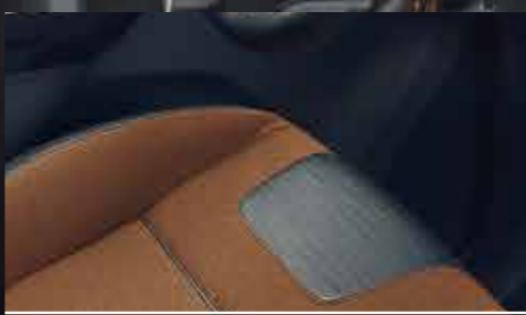
运动风格拼接座椅 采用标志性的橘色缝线的精致工艺，将皮质与极限橘运动针织面料拼接。