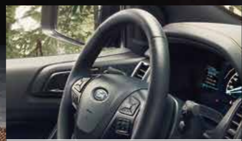
多功能方向盘 真皮包裹赋予细腻触感，更汇集声控、电话、音响、定速和资讯等功能于一体。