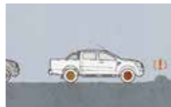
- EBA刹车力道辅助系统