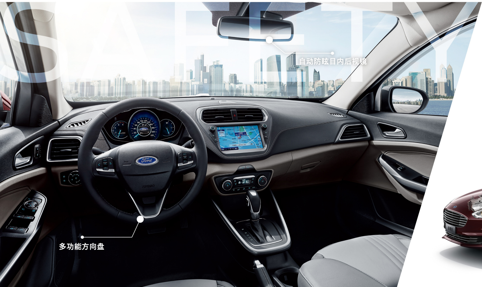
自动防眩目内后视镜