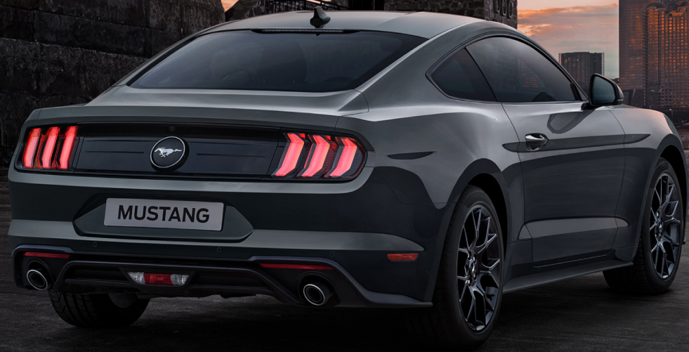
Carbonized Grey 碳素灰

航空航天科技的飞速发展，使碳纤维成为炙手可热的新材料，在改变科技进程的同时，成为不断探索无惧前行的代表产物。 2021福特Mustang的全新车色——碳素灰，便是以响应科技，宣扬智能的方式致敬从未消退过的探索精神。