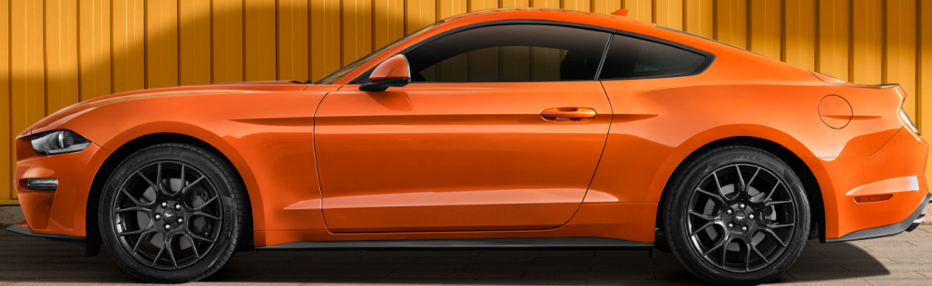
Twister Orange 暴风橙

承袭历代Mustang家族基因，每寸经典车身线条都尽现凌厉潮酷，动感外形造就更低姿态的视觉冲击，肆意展现真我锋芒。