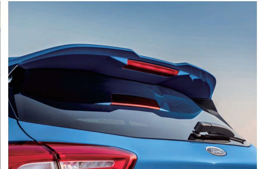
賽道級大型擾流尾翼