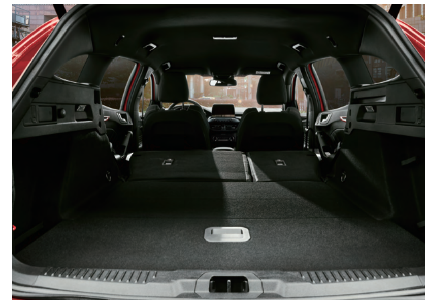
Hands-Free 足踢感應式電動尾門* / 行李廂後座快傾拉桿

以 ST 極致駕馭性能為名，德製高性能旅行車 FOCUS ST WAGON，擁有旅行車出色內置空間與絕美修長身形設計，完美兼具跑格與風格；配備行李廂後座快傾拉桿、足踢感應式電動尾門，讓旅程動感前行。德製高性能旅行車 FOCUS ST WAGON，為征服 Autobahn 而生，只願被你征服。