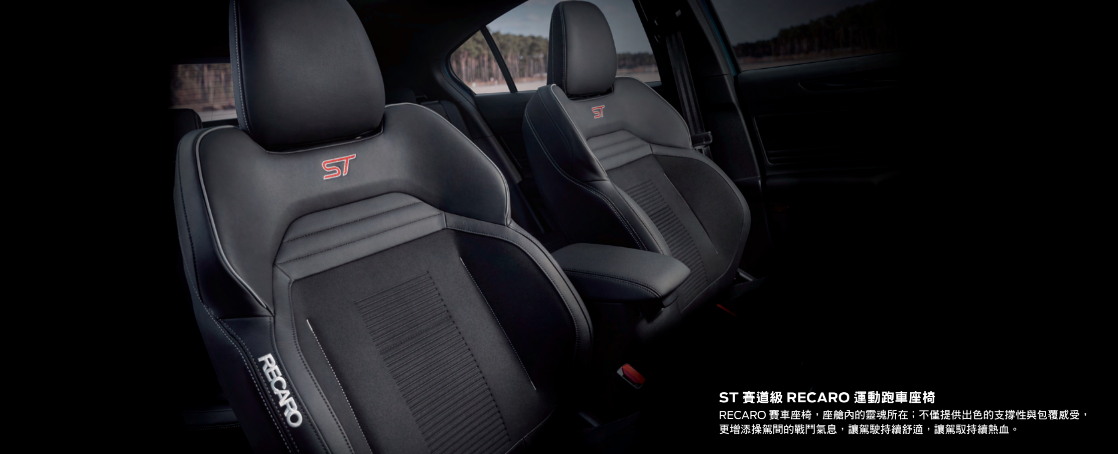
ST 賽道級 RECARO 運動跑車座椅 RECARO 賽車座椅，座艙內的靈魂所在；不僅提供出色的支撐性與包覆感受，更增添操駕間的戰鬥氣息，讓駕駛持續舒適，讓駕駛持續熱血。