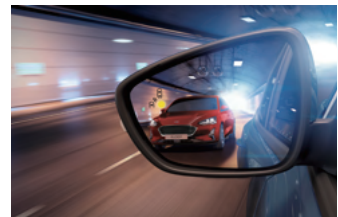
BLIS® 視覺盲點偵測系統 (附 CTA 倒車來車警示系統)