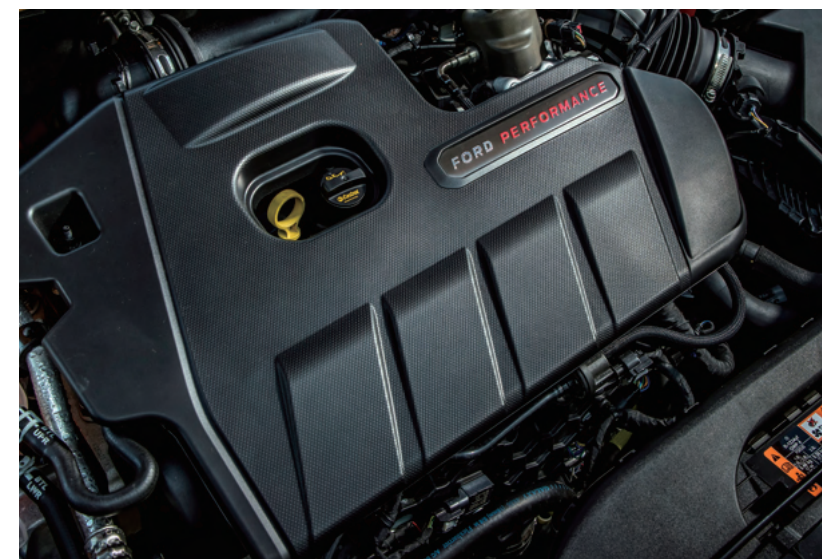
EcoBoost® 雙渦流渦輪增壓汽油引擎