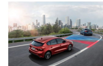
IACC 智慧型定速巡航調節系統 (附低速跟車) LCA 車道導正輔助系統

將規格相容的手機或使用相容充電背蓋的手機裝置放在車內的充電座上，即能輕鬆充電，無需使用傳輸線。