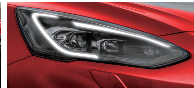
AFS 頭燈主動式轉向照明輔助系統* / 旭日之刃型 LED 日行燈*