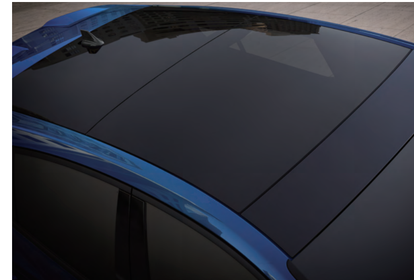
全景式大型電動車窗

德製性能鋼砲 FOCUS ST 的狂野，擁有雙車身線條設計搭配前後下擾流、側裙及賽道級大型擾流尾翼，競技型 Performance Pack 套件盡顯前驅性能鋼砲的不羈自信，動靜皆是王者風範。