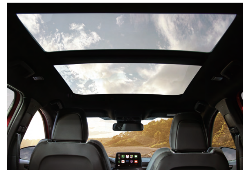
全景式大型電動天窗*