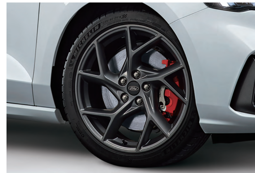
18 吋 Michelin Pilot Sport 4S 高性能跑胎* ST 專屬賽道級煞車系統（專屬紅色卡鉗 / 專屬加大碟盤）