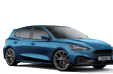
7L Ford Performance Blue