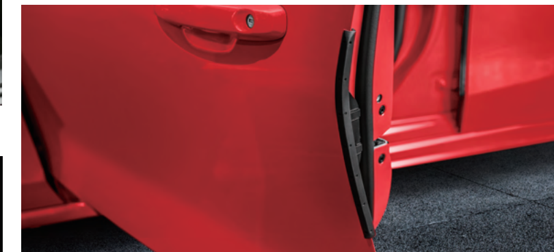
四門伸縮型防護邊條*