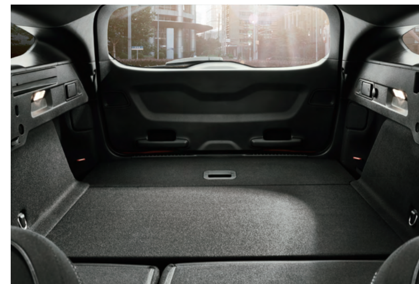
行李廂後座快傾拉桿*