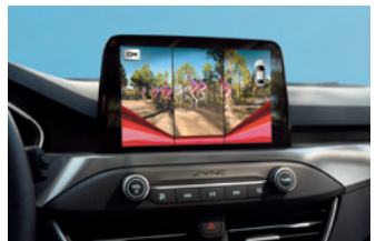
雙模式倒車顯影輔助系統 (一般及 180 度廣角)