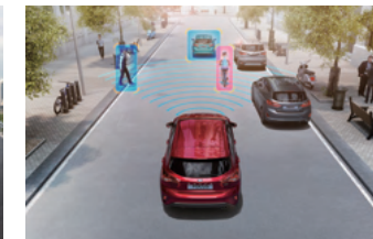
PCA 前向碰撞預警系統 (附 AEB 全速域輔助煞停系統)