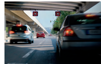
ISA 智慧型速限輔助系統 TSR 道路標誌識別輔助系統