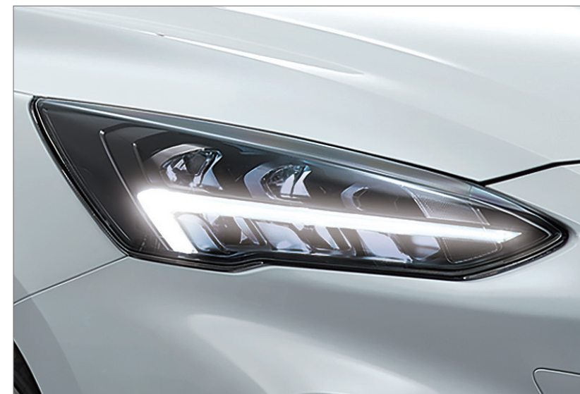
奪目之鑷型 LED 日行燈*

FOCUS ST WAGON – SLS Edition 致敬“HOME OF FOCUS” FORD 德國 Saarlouis 製造廠，自 1998 年推出第一代 FOCUS，迄今已在全球締造超過 20 年輝煌傳奇。烙以德國 Saarlouis 車籍代碼 SLS 之名，展現出身德製，熱血傳承德意志的純正血統；亦傳達 SPORTY & LIGHT STATION WAGON 性能調教的駕馭精髓，再次驅動你桀驁的靈魂。