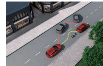
ESA 閃避轉向輔助系統