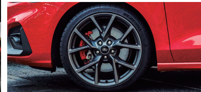
19 吋 Michelin Pilot Sport 4S 高性能跑胎* ST 專屬賽道級煞車系統（專屬紅色卡鉗 / 專屬加大碟盤）

* Hands-Free 足踢感應式電動尾門、AFS 頭燈主動式轉向照明輔助系統及旭日之刃型 LED 日行燈適用於 FOCUS ST WAGON 車型。 * 全景式大型電動天窗、四門伸縮型防護邊條及 19 吋 Michelin Pilot Sport 4S 高性能跑胎適用於 FOCUS ST WAGON 及 FOCUS ST 五門車型。* 此為展示車型，外觀樣式及內裝配備與實際上市車型有所差異，請以實際販售之車型及規格配備為準。