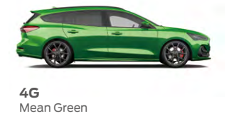
4G Mean Green