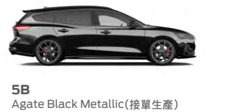
5B Agate Black Metallic (接單生產)