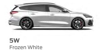
5W Frozen White