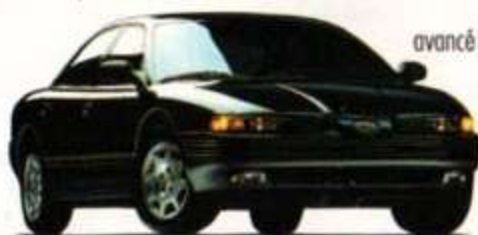
Eagle Vision. Une nouvelle façon de voir l'automobile.

La série de berlines LH — la Eagle Vision et les Chrysler Concorde et Chrysler Intrepid — est le résultat bien concret de cette approche complètement différente de la fabrication automobile. L'«habitacle avancé» va influencer le design automobile jusqu'à la fin des années 90.