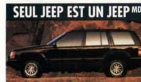
Jeep Grand Cherokee. Pour les sentiers non battus.

Le Jeep Grand Cherokee est le dernier-né de sa famille. Il représente l'engagement permanent de Chrysler à offrir un véhicule tout terrain doté du luxe et de la sécurité.