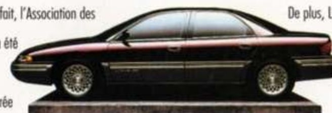
Chrysler Concorde. Filez le parfait bonheur.

Une véritable avalanche de prix. En fait, l'Association des journalistes automobile du Canada a été si impressionnée par la série de berlines LH qu'elle l'a d'abord déclarée «Meilleure nouvelle voiture familiale 1993» avant de lui attribuer, carrément,