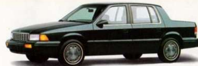
DODGE SPIRIT/PLYMOUTH ACCLAIM ENSEMBLE 22E

Remise en argent de 1 000 $ incluse ainsi que la taxe fédérale de 100 $ sur le climatiseur.