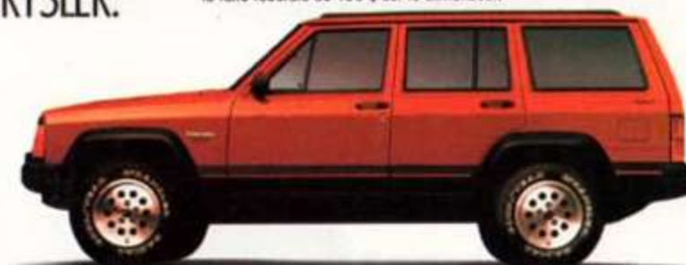
JEEP CHEROKEE SPORT 4 PORTES & 4 RM ENSEMBLE 26E

Remise en argent de 1250 $ incluse ainsi que la taxe fédérale de 100 $ sur le climatiseur.