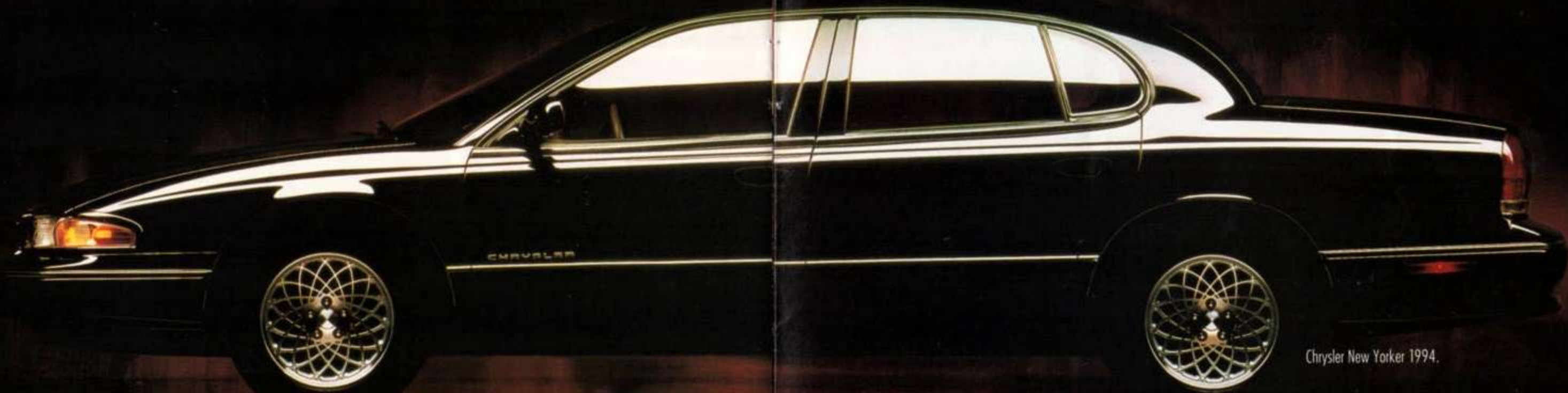
Chrysler New Yorker 1994.