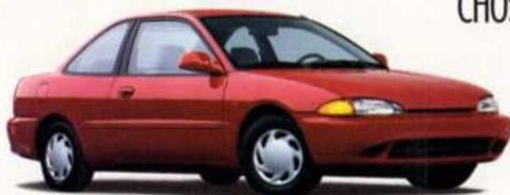
COLT 1993 DE DODGE ET PLYMOUTH ET EAGLE SUMMIT DL 1993 ENSEMBLE 21A

Remise en argent de 1250 $ incluse ainsi que la taxe fédérale de 100 $ sur le climatiseur.