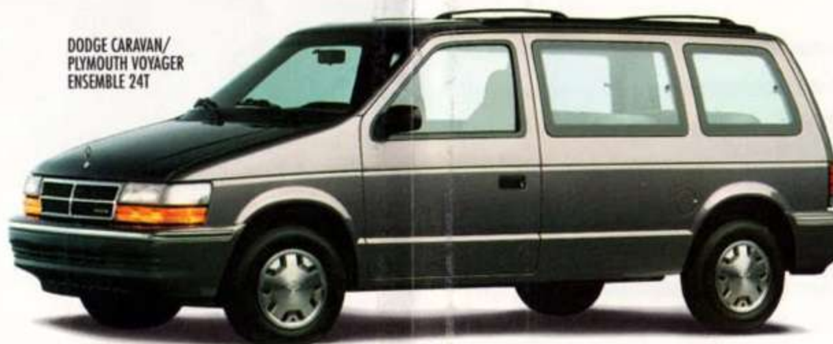
DODGE CARAVAN/ PLYMOUTH VOYAGER ENSEMBLE 24T

ON A CHANGÉ NOS VOITURES ET NOS CAMIONS. ON A CHANGÉ NOTRE COMPAGNIE. MAIS UNE SEULE CHOSE NE CHANGERA PAS : L'EXCELLENTE QUALITÉ ET LES PRIX QUE VOUS ATTENDEZ DE CHRYSLER.