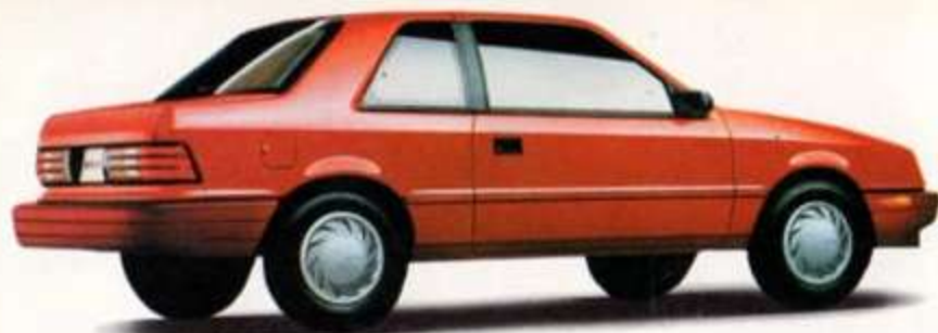
DODGE SHADOW/PLYMOUTH SUNDANCE ENSEMBLE 22D