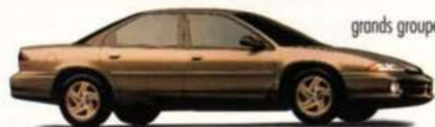
Chrysler Intrepid. Allure unique. Confort unique.

Nous avons levé les barrières traditionnelles entre les services. Les grands groupes